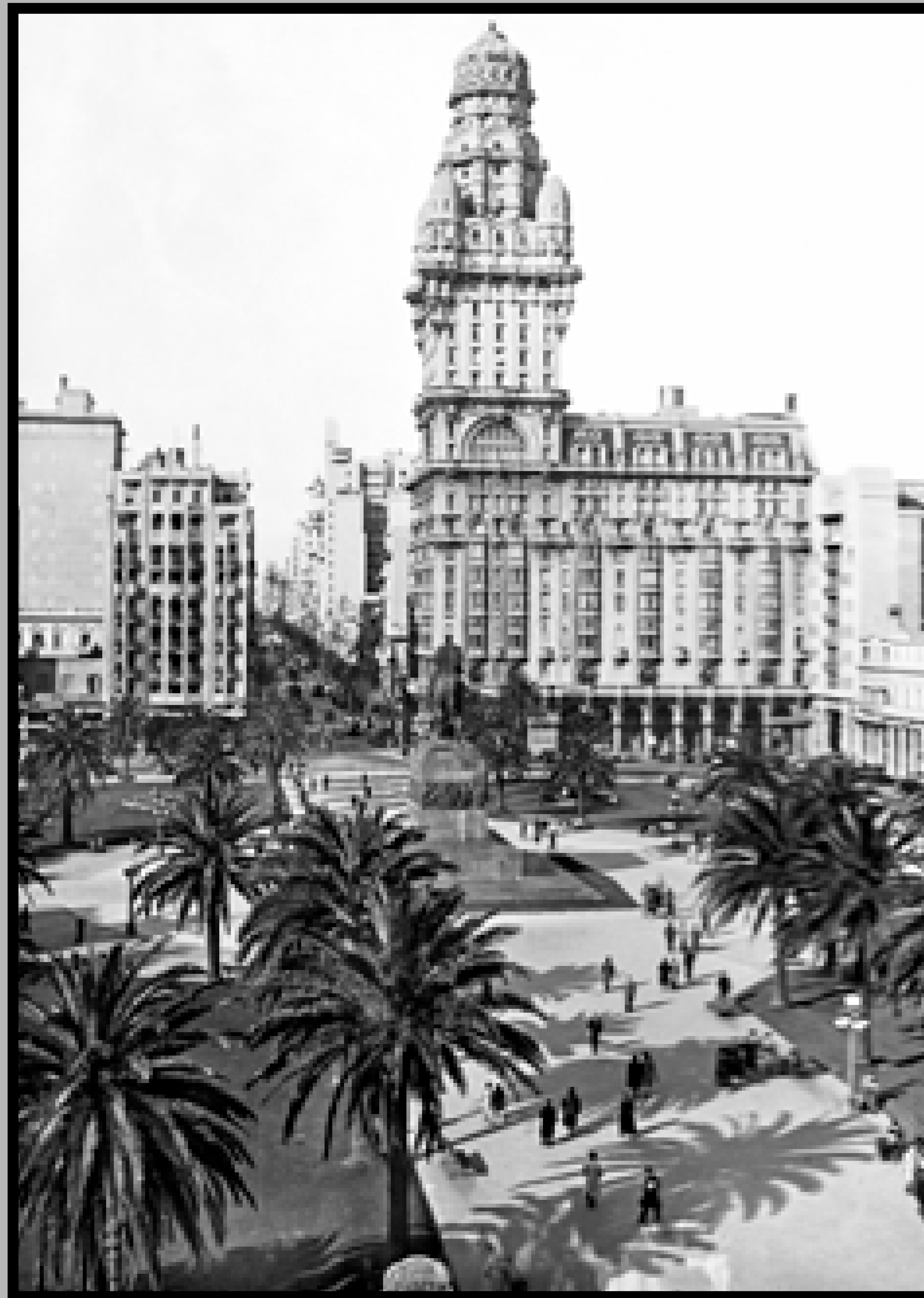
Plaza Independencia y Palacio Salvo. Año 1940..