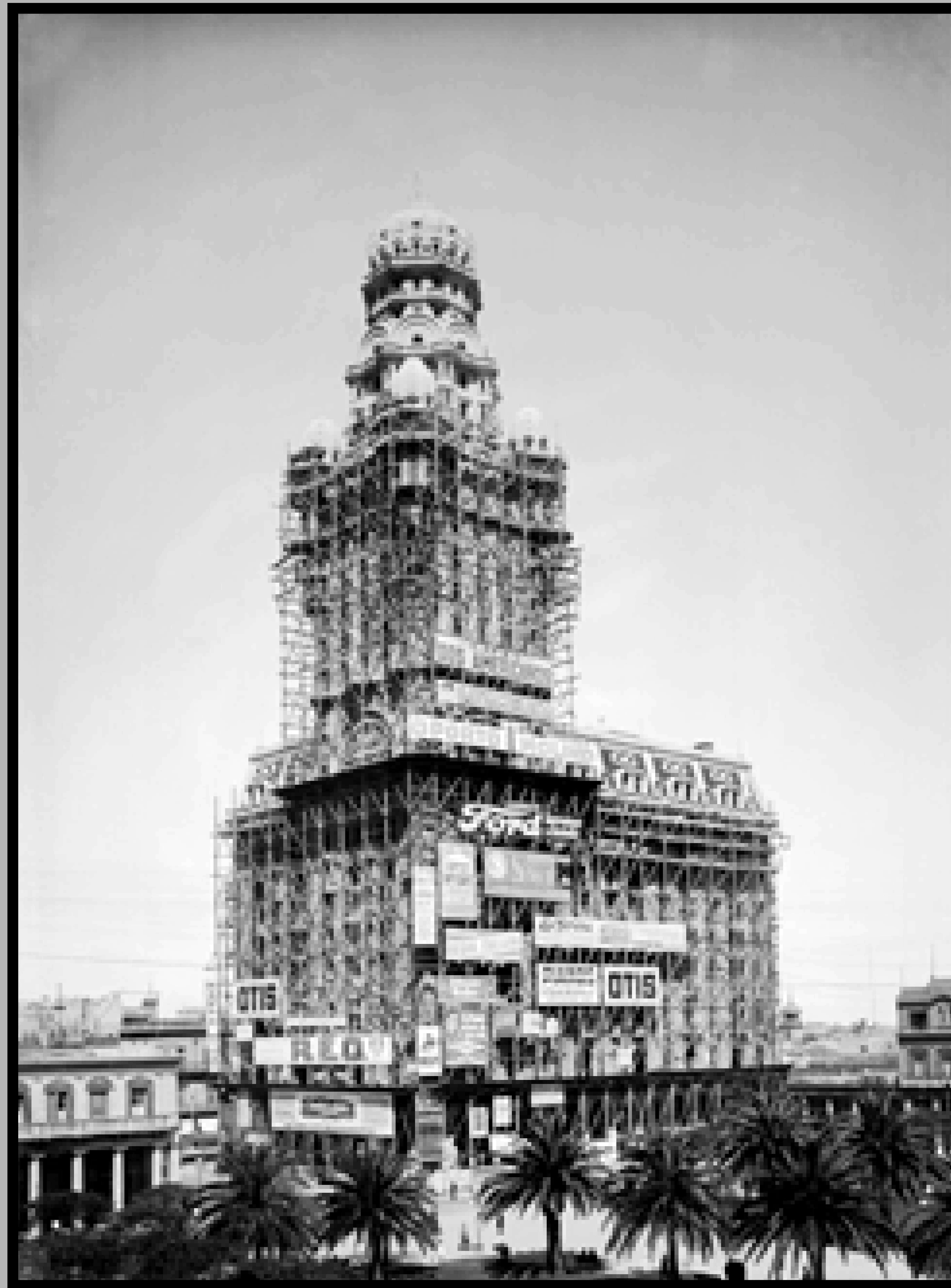
Palacio Salvo en construcción. Año 1927 (aprox.). (Foto: 04353FMHGE.CDFIMO.UY - Autor: S.d./IMO).