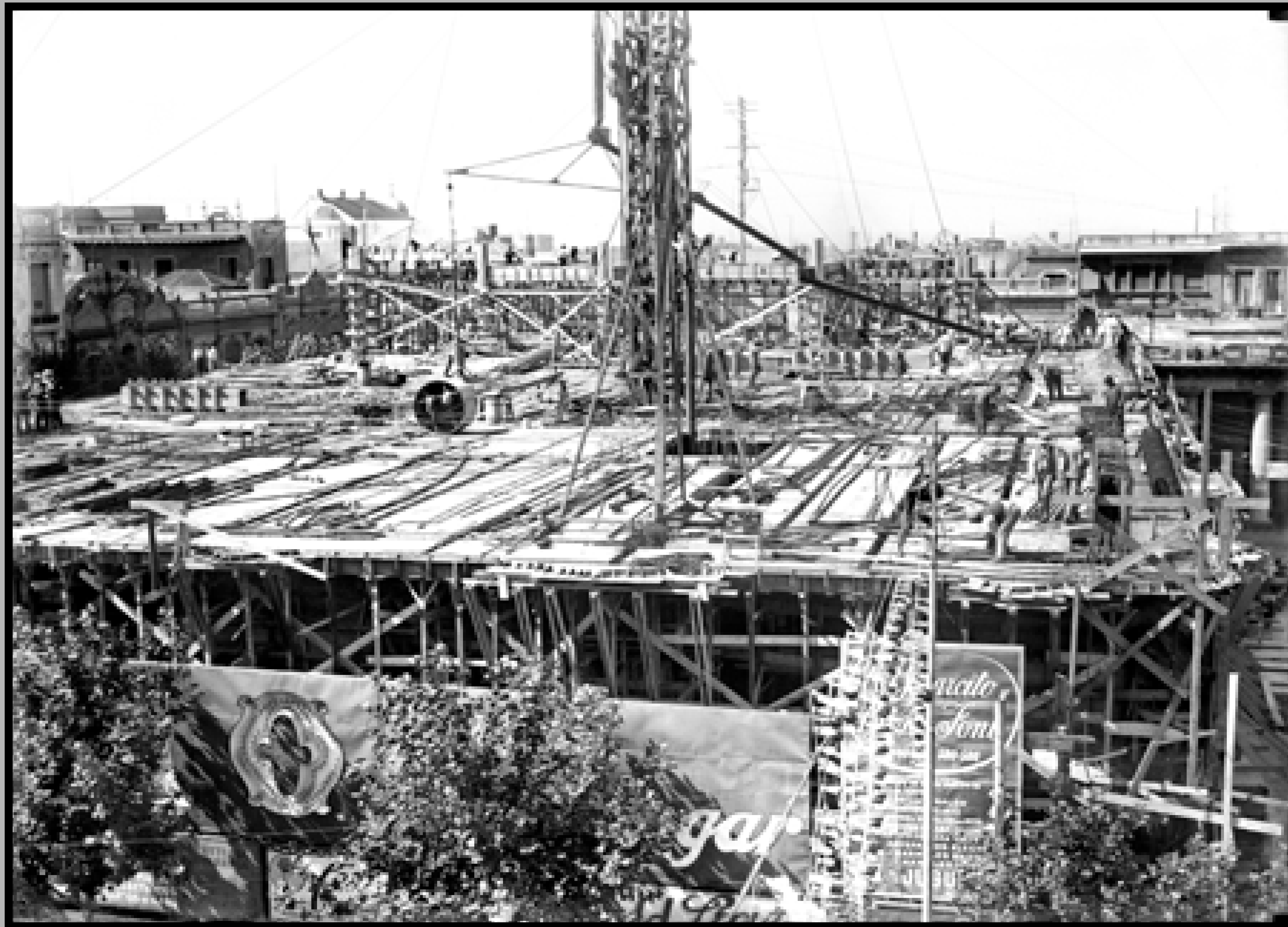
Construcción del Palacio Salvo. Año 1923 (aprox.)..