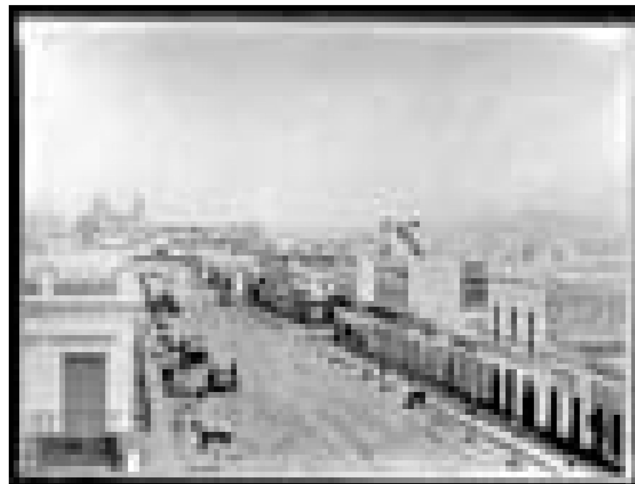
Avenida 18 de Julio y calle Río Negro. Al fondo: entrada al Mercado Viejo (actual Plaza Independencia), Iglesia Matriz y Cerro de Montevideo.

Fecha: 30 de junio de 1934. Productor: Intendencia de Montevideo Autor: S.d. Código de referencia: 0468FMHC Soporte: Vidrio Técnica Fotográfica: Gelatina y plata