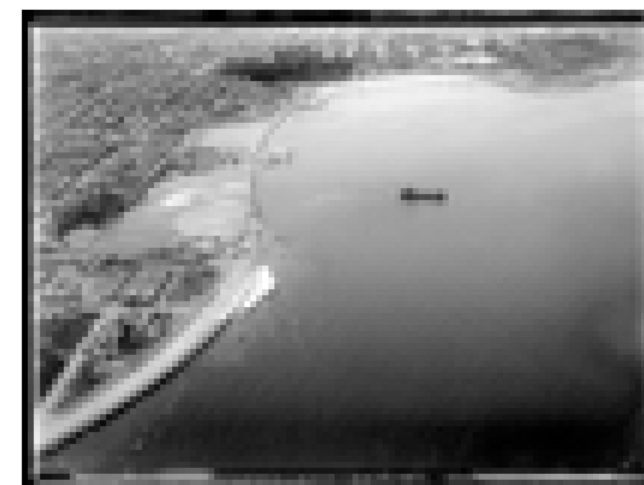
Vista aérea de las playas de Santa Ana y Patricio durante las obras de drenaje y relleno para la construcción de la Rambla Sur.

Fecha: S.f. Productor: Intendencia Municipal de Montevideo Autor: S.d. Código de referencia: 0776FMHB Soporte: Vidrio Técnica Fotográfica: Gelatina y plata