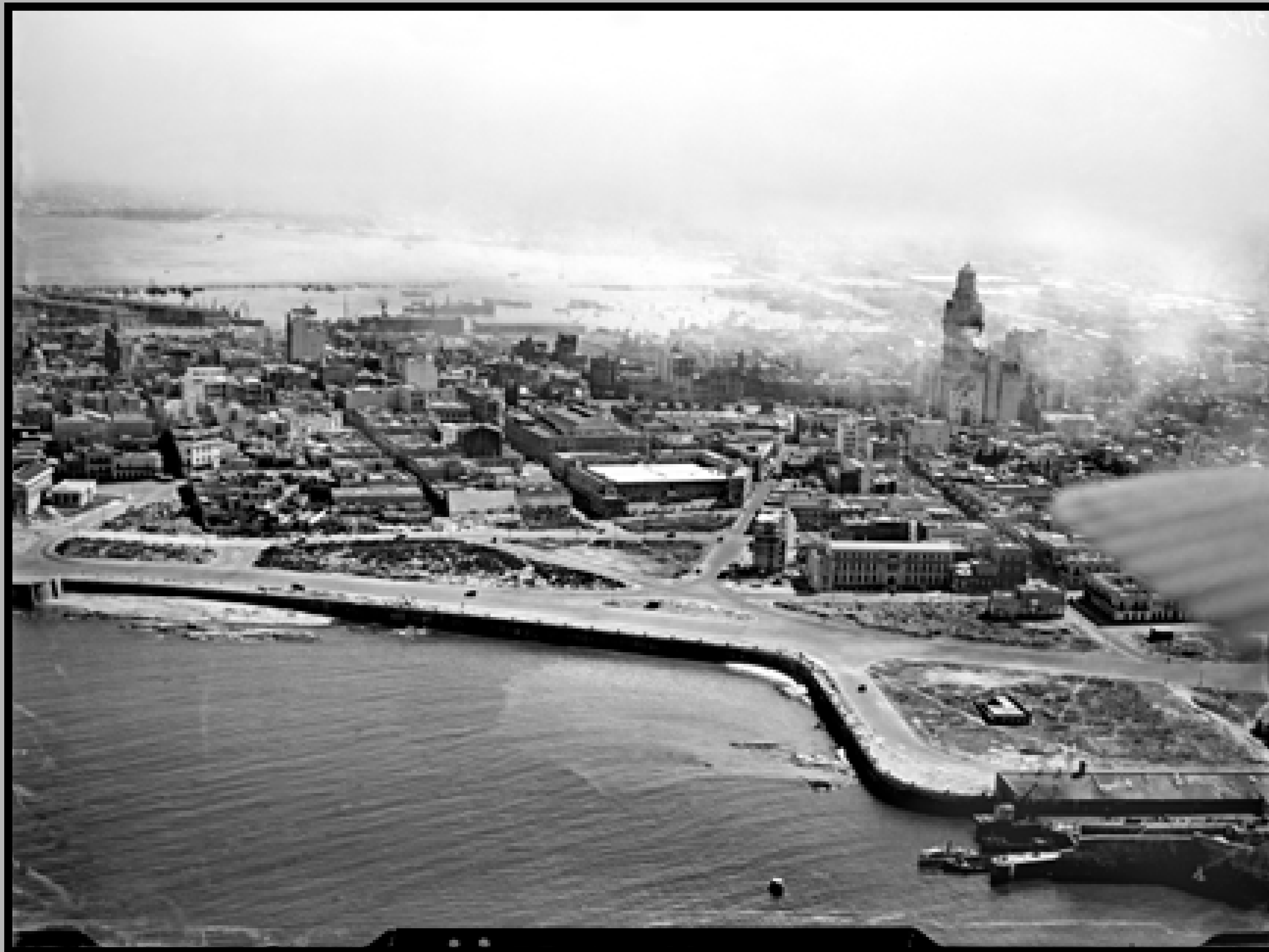
Vista aérea de tramo de la Rambla Gran Bretaña. A la derecha: Palacio Salvo. Década de 1940 (aprox.).