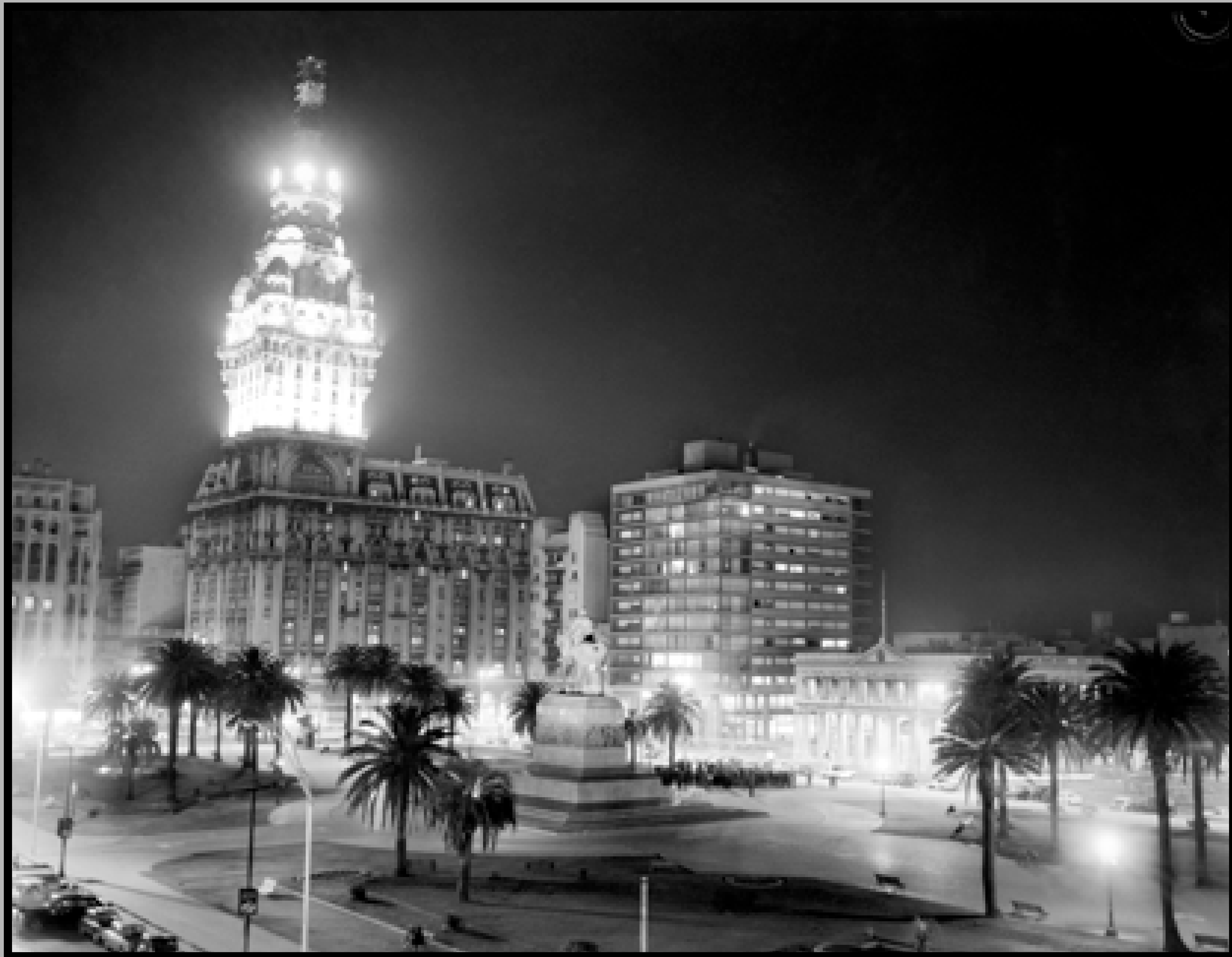
Palacio Salvo, Plaza Independencia y Palacio Estévez. S.f. (Foto: 11016FMHGECDFIMO.UY - Autor: S.d./IM).