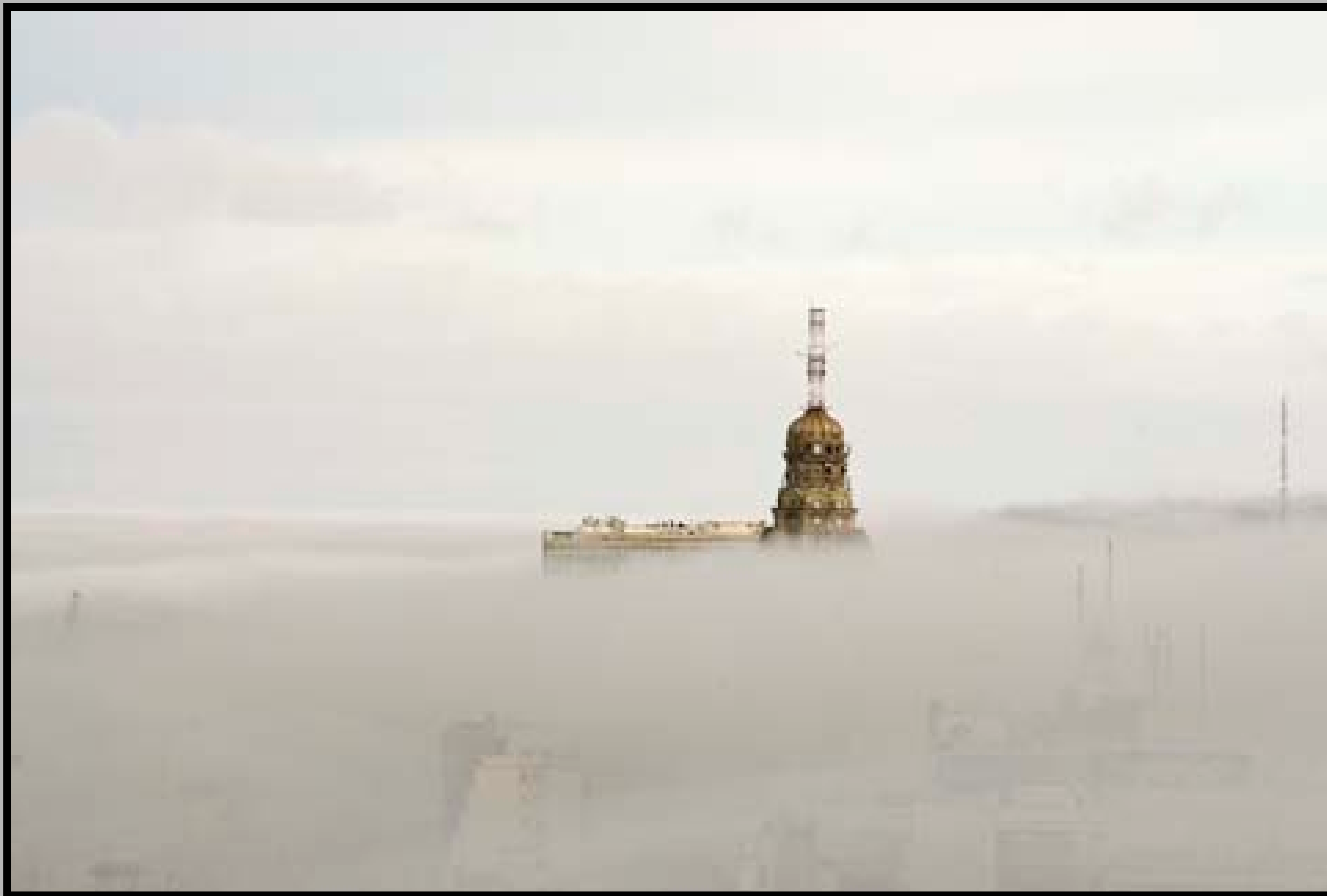
Palacio Salvo. Toma efectuada desde el mirador de la Intendencia de Montevideo. 14 de mayo de 2007.