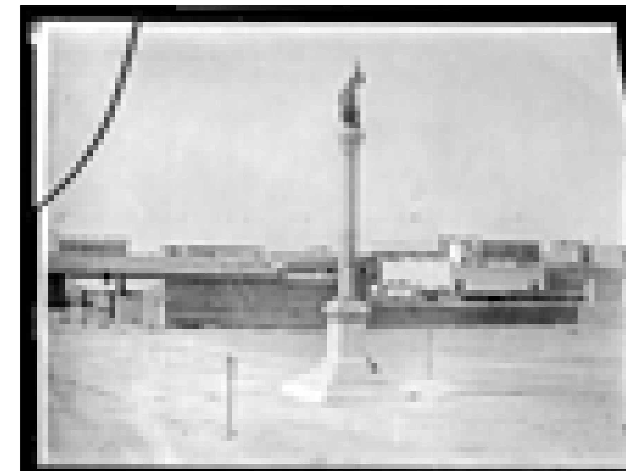
Columna de la paz. Calle 18 de Julio y Plaza Cagancha.

Fecha: Año 1865. Productor: Intendencia Municipal de Montevideo Autor: S.d. Código de referencia: 0054FMHB Soporte: Vidrio Técnica Fotográfica: Gelatina y plata