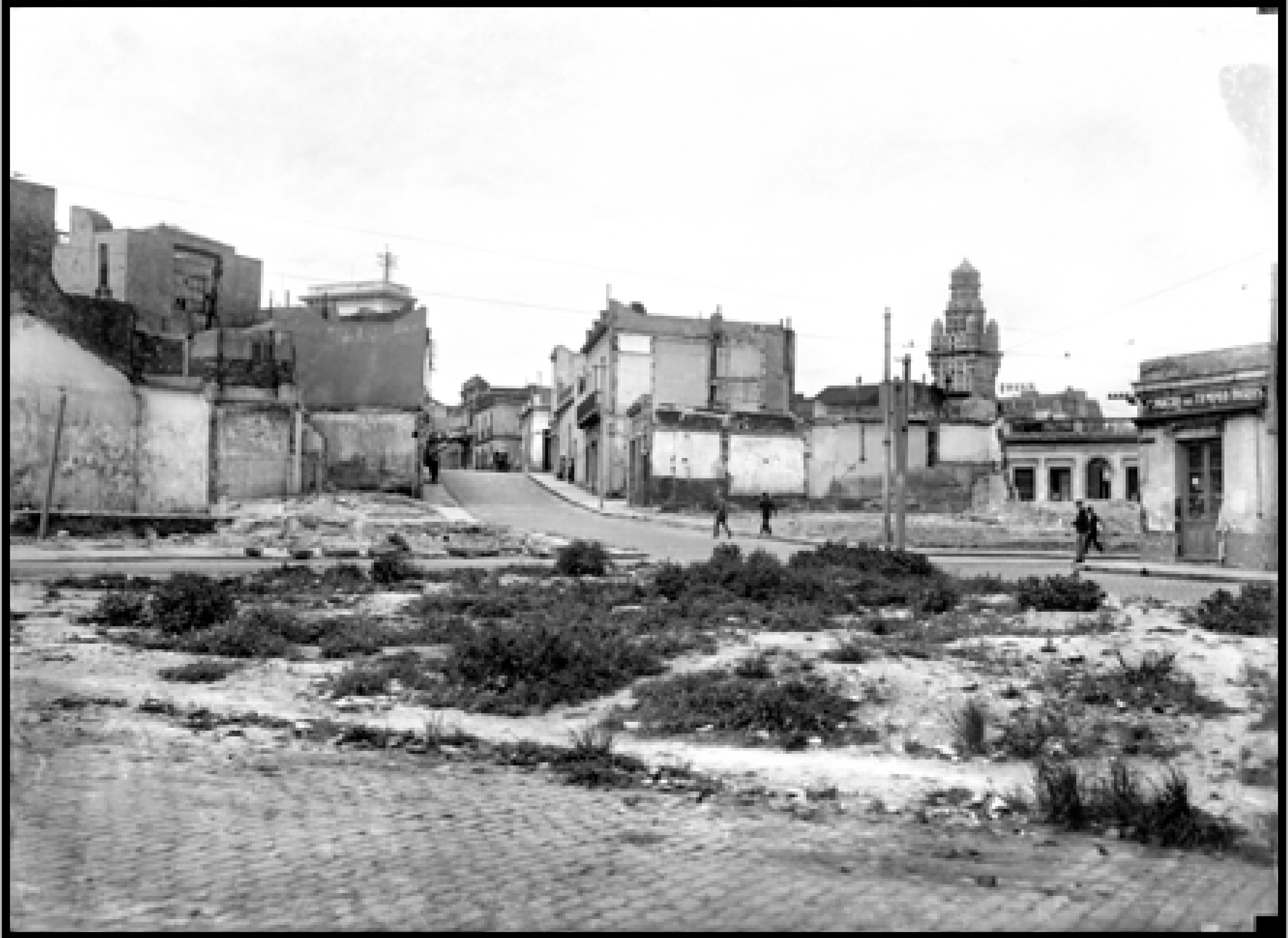
Zona del Bajo. Al fondo: Palacio Salvo. S.f. (Foto: 0715FMHB.CDFIMOUY - Autor: S.d./IM).