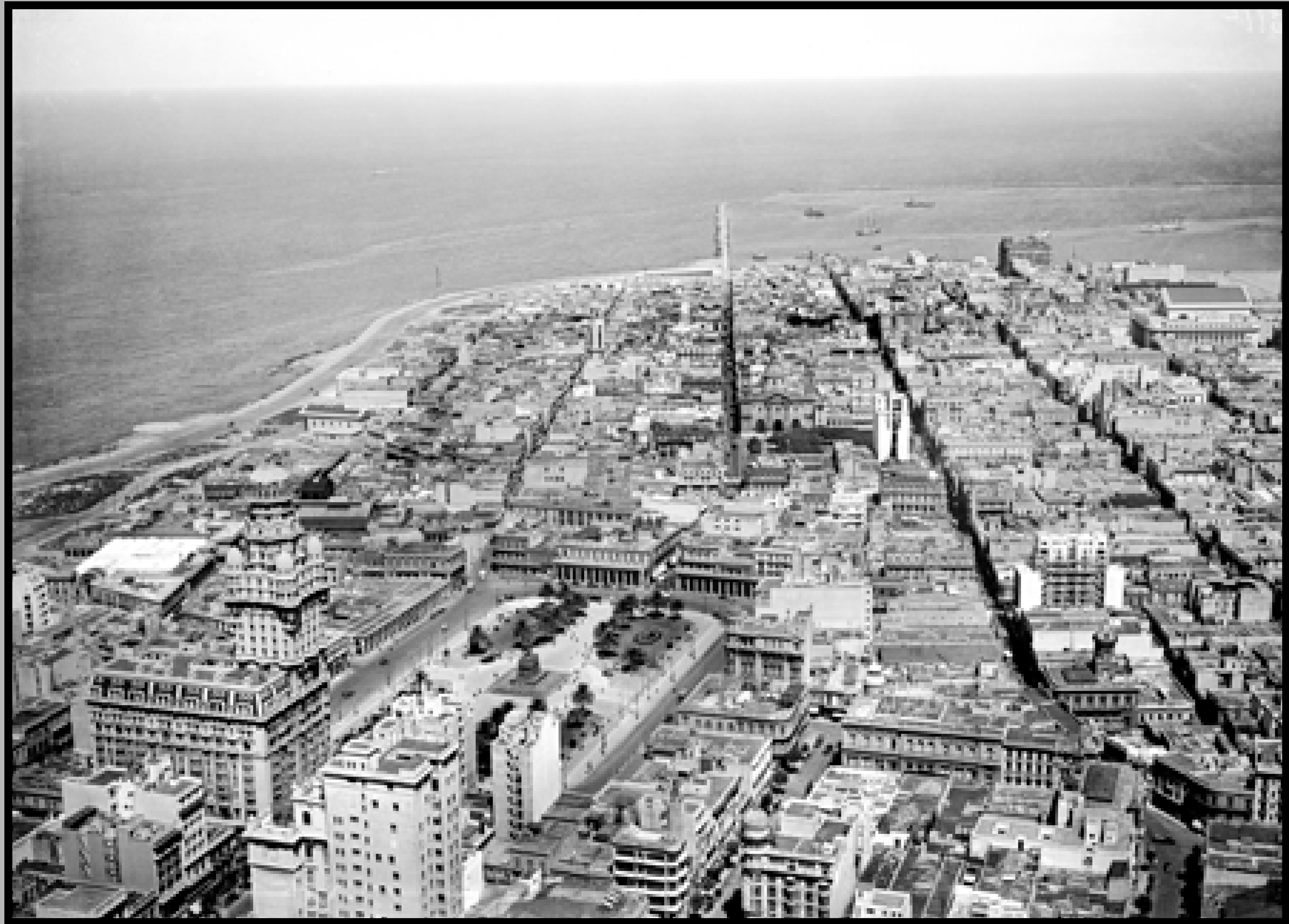
Vista aérea de la Ciudad Vieja. Abajo, a la izquierda: Palacio Salvo y Plaza Independencia. Año 1936.