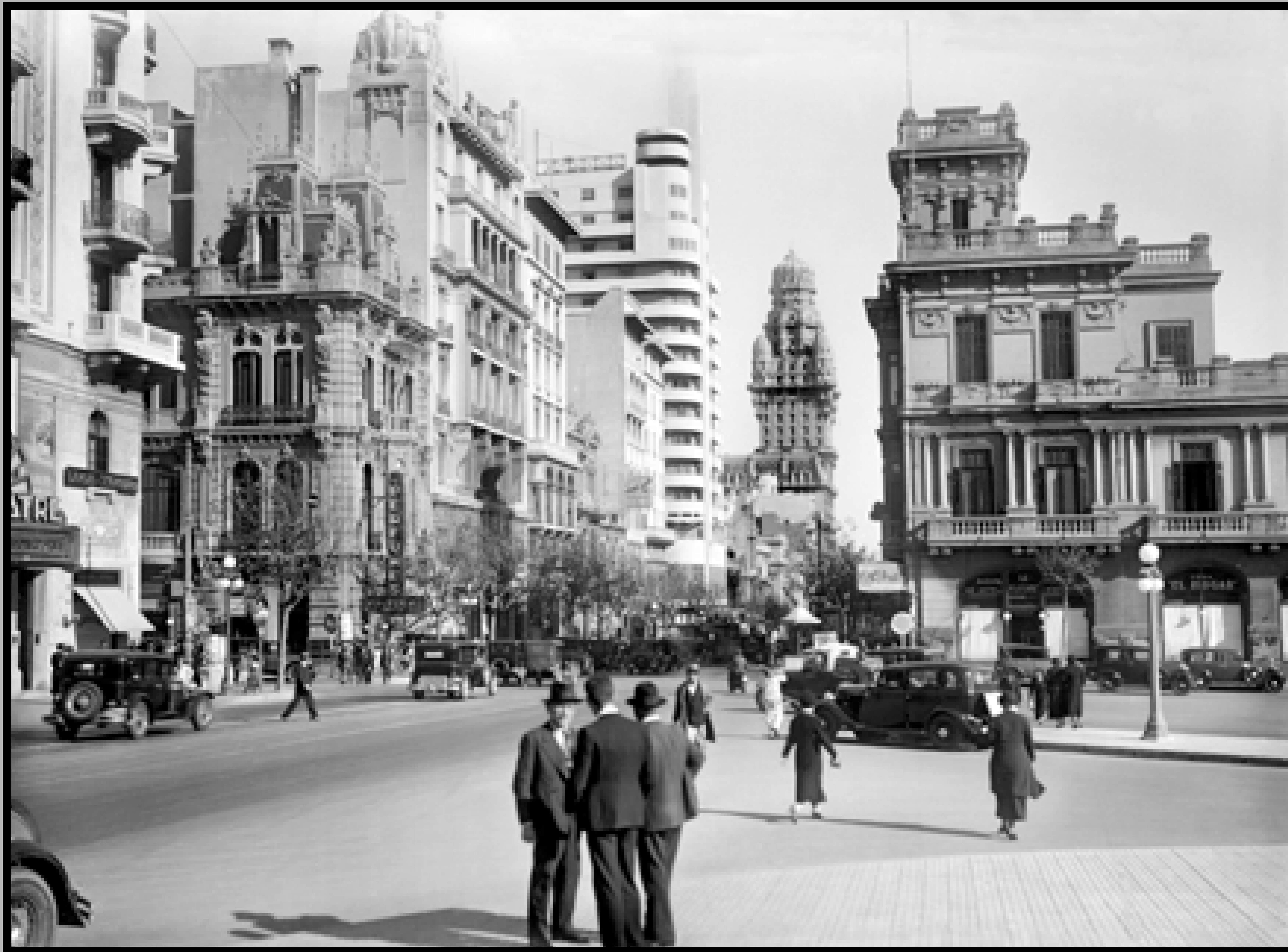
Avenida 18 de Julio, esquina Río Negro. Al fondo: Palacio Salvo. Año 1935.