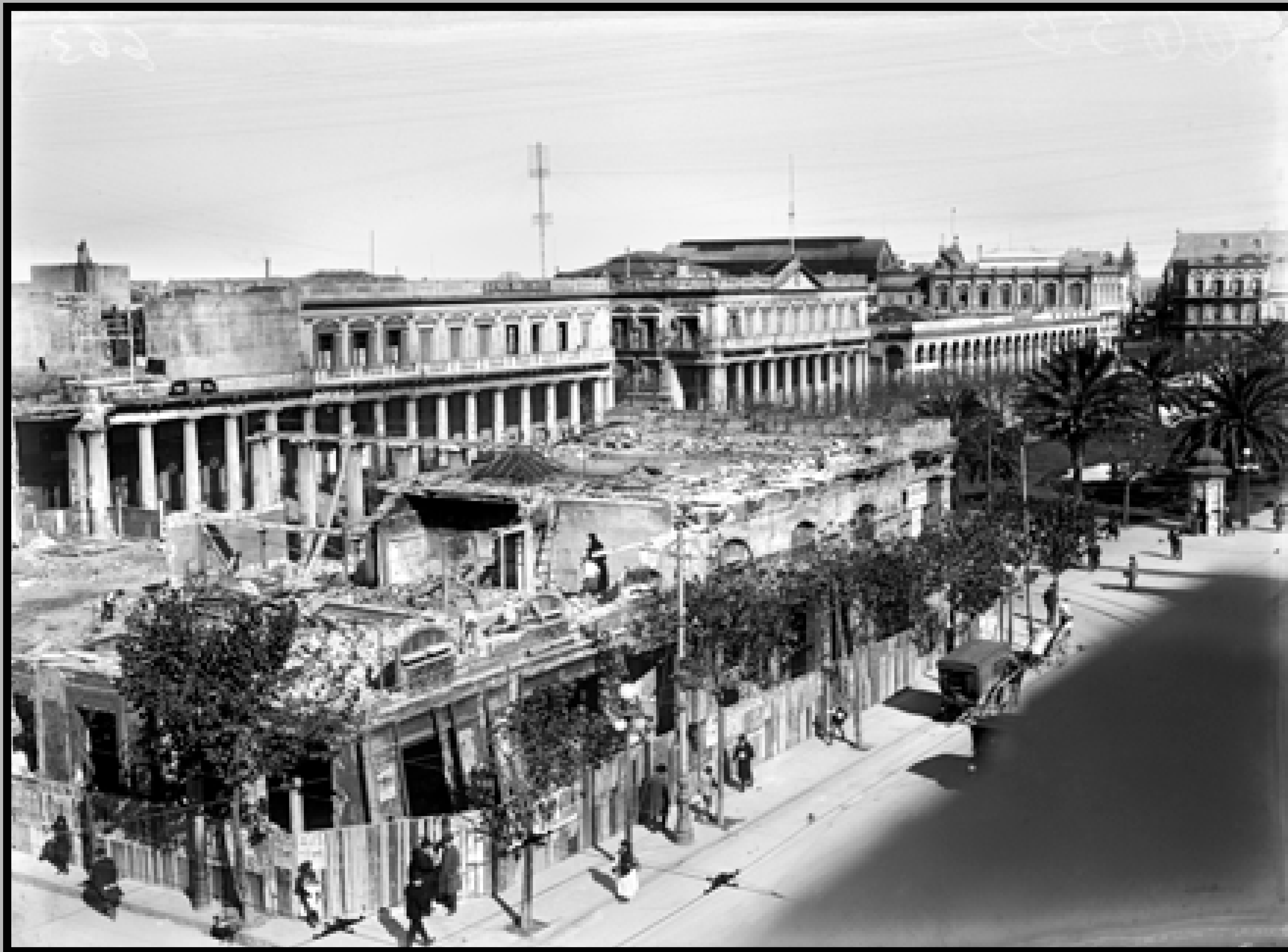
Café y confitería La Giralda en demolición. Avenida 18 de Julio. Año 1922. (Foto: 0663FMHB.CDFIMO.UY - Autor: S.d./IM).