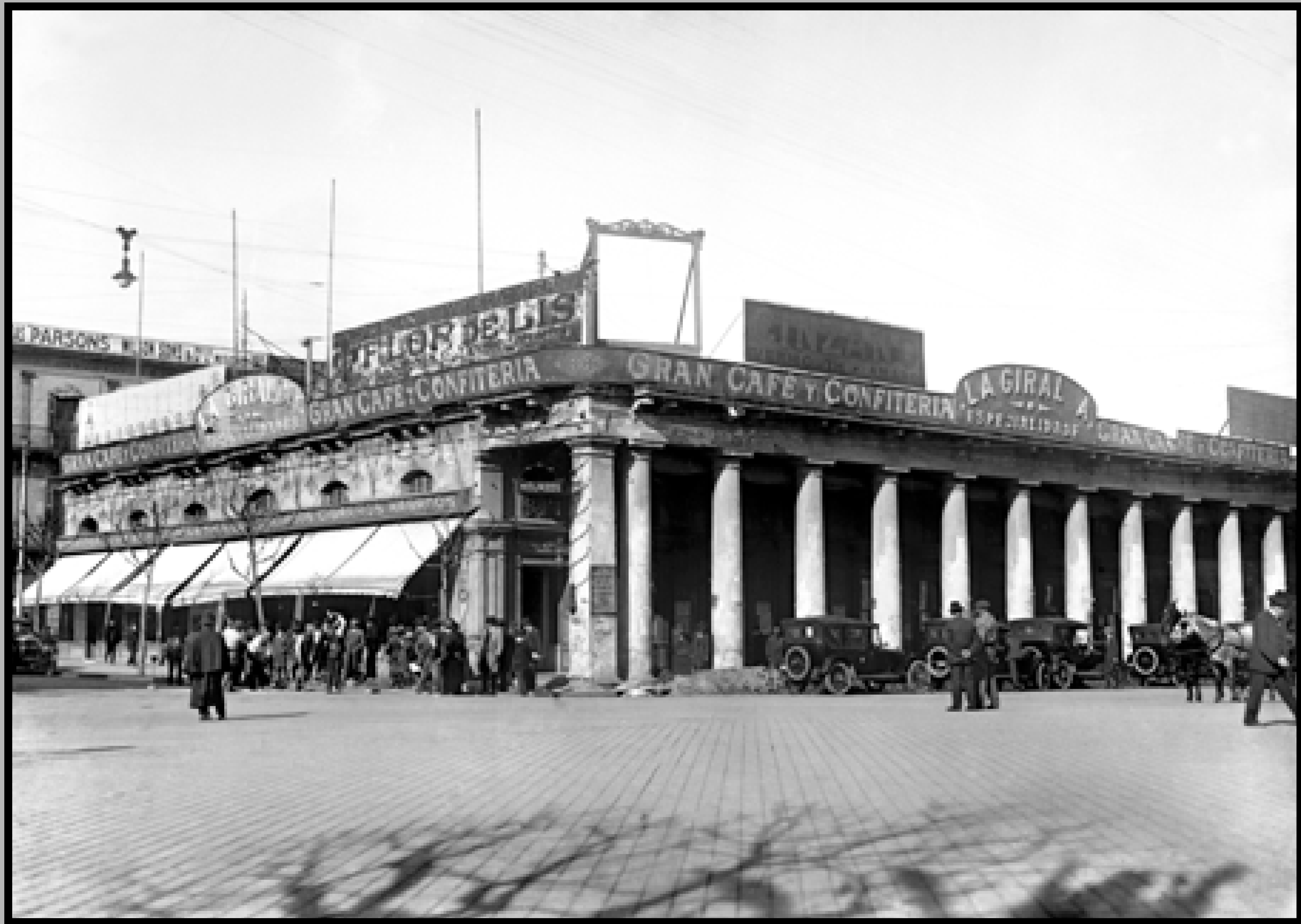
Café y confitería La Giralda. Esquina de la avenida 18 de Julio y Plaza Independencia. Año 1920 (aprox.). (Foto: 0126FMHBCDFEIMO.UY - Autor: S.d./IMO).