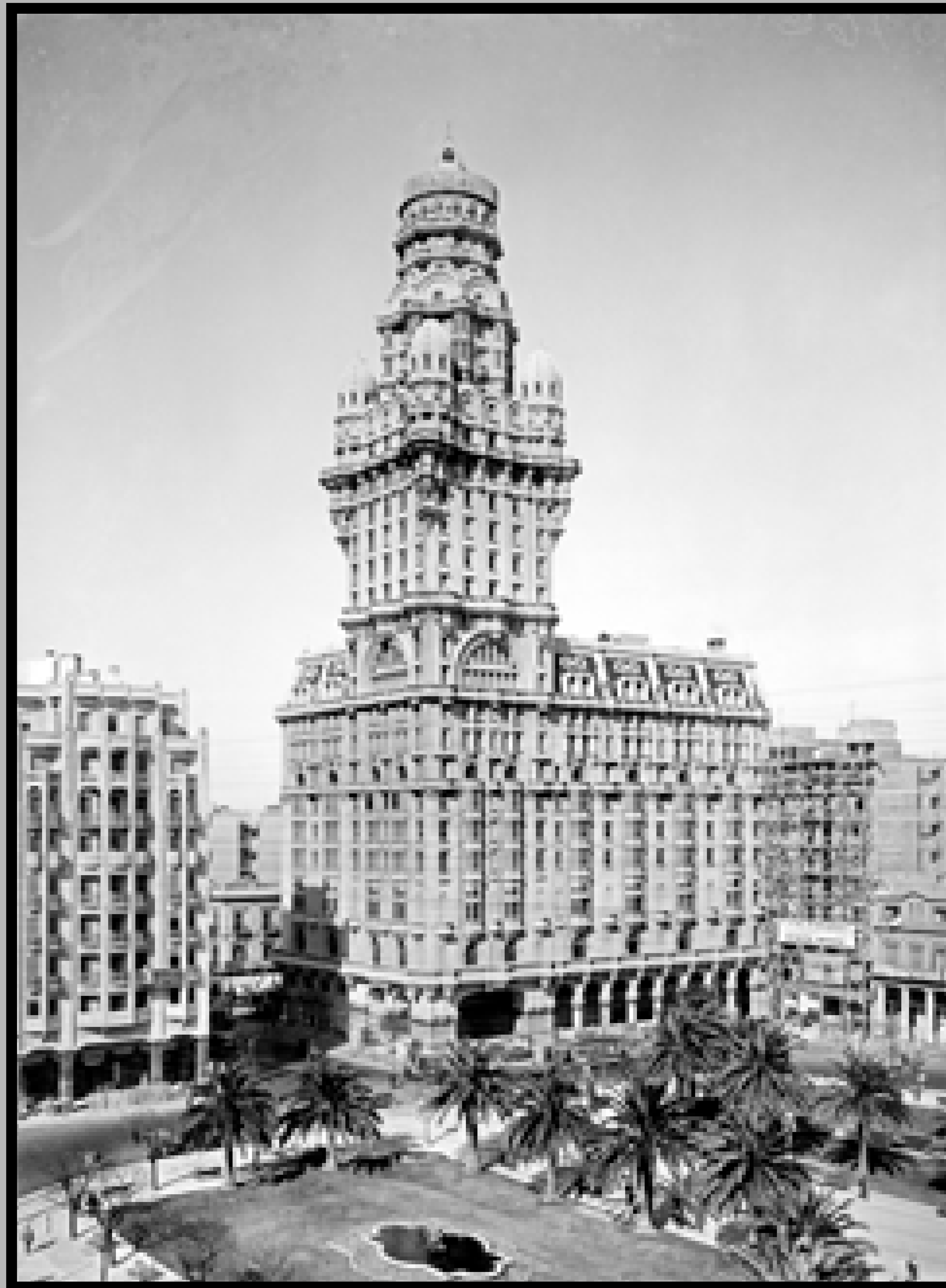
Palacio Salvo. Año 1929.