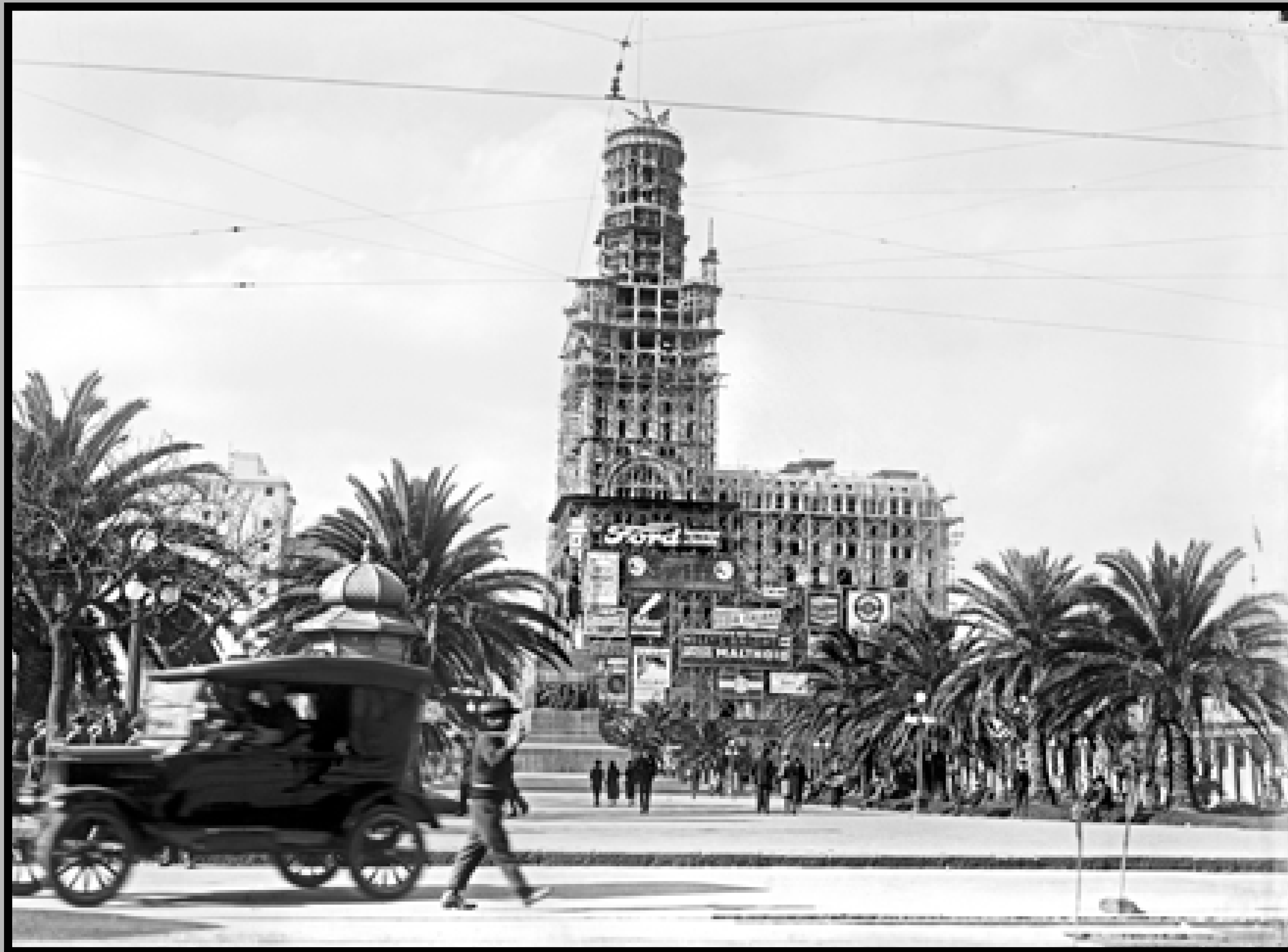
Palacio Salvo en construcción. Al centro: Plaza Independencia. Año 1925.