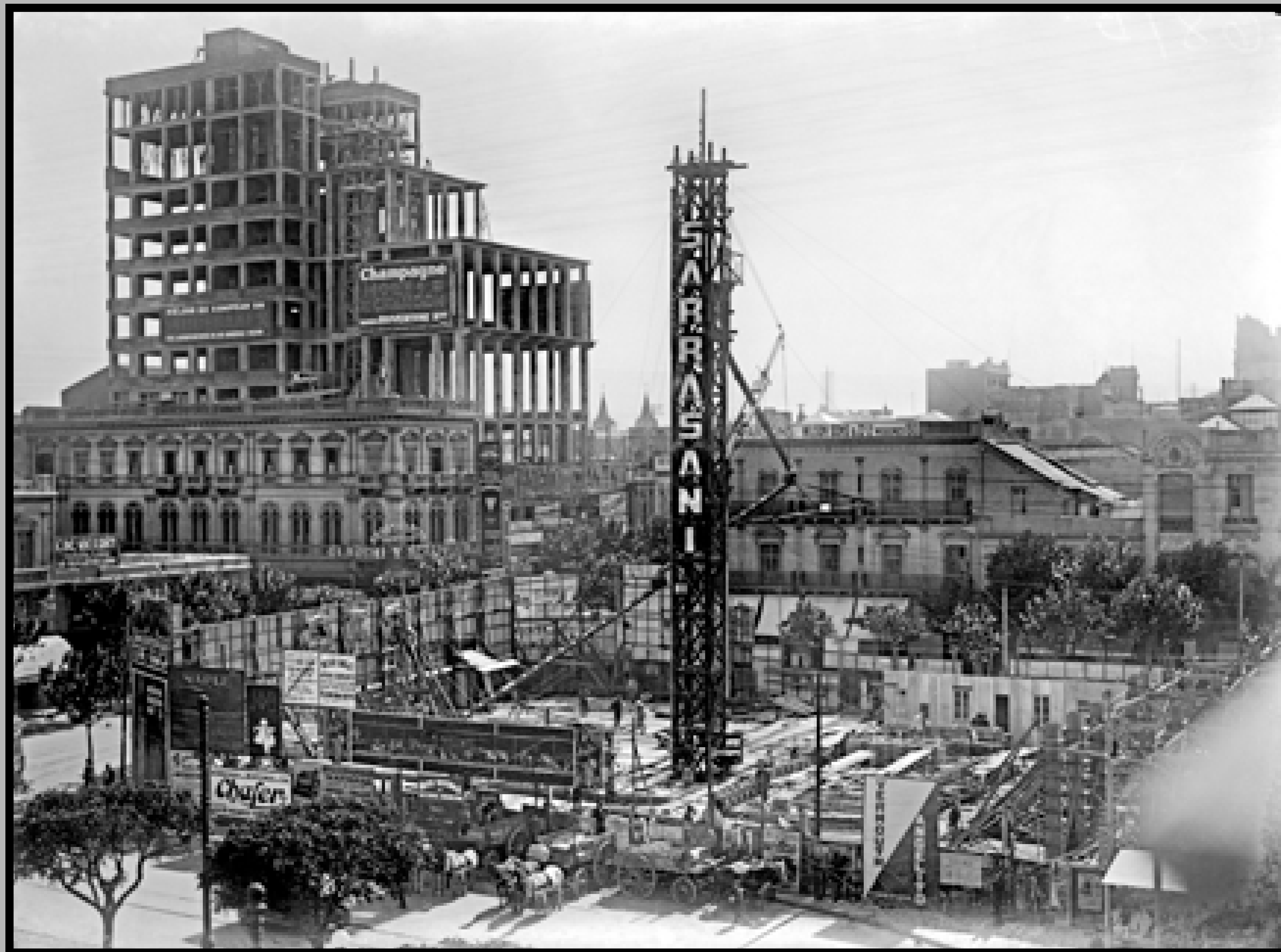
Comienzos de la construcción del Palacio Salvo. Al fondo, a la izquierda: construcción del edificio del Jockey Club. Año 1923 (aprox.).