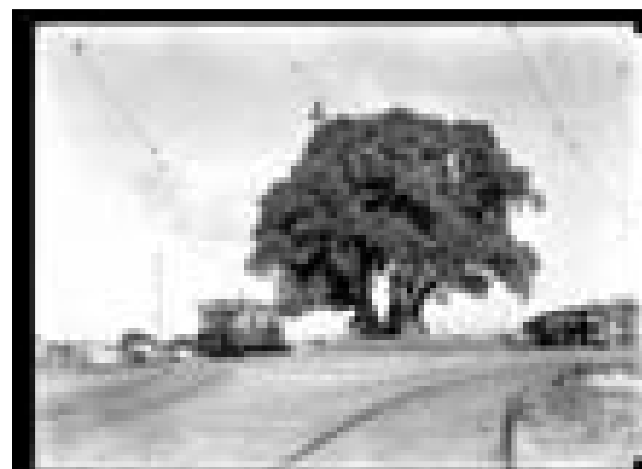
Ombú ubicado en Bulevar España y calle Luis de la Torre.

Fecha: Año 1920. Productor: Intendencia de Montevideo Autor: S.d. Código de referencia: 1471FMHB Soporte: Vidrio Técnica Fotográfica: Gelatina y plata