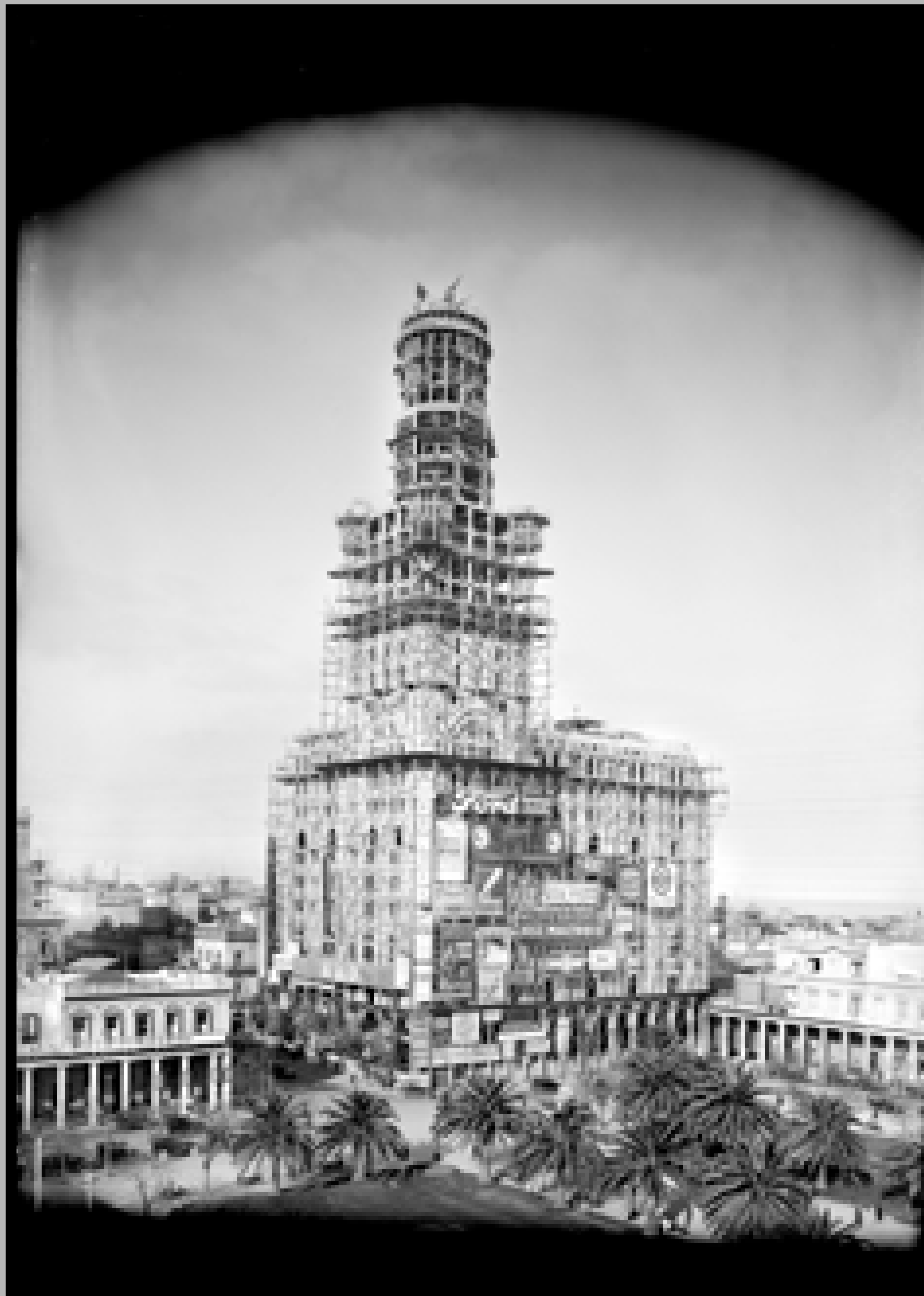
Palacio Salvo en construcción. Año 1925. (Foto: 0685FMHB.CDFIMO.UY - Autor: S.d./IM).