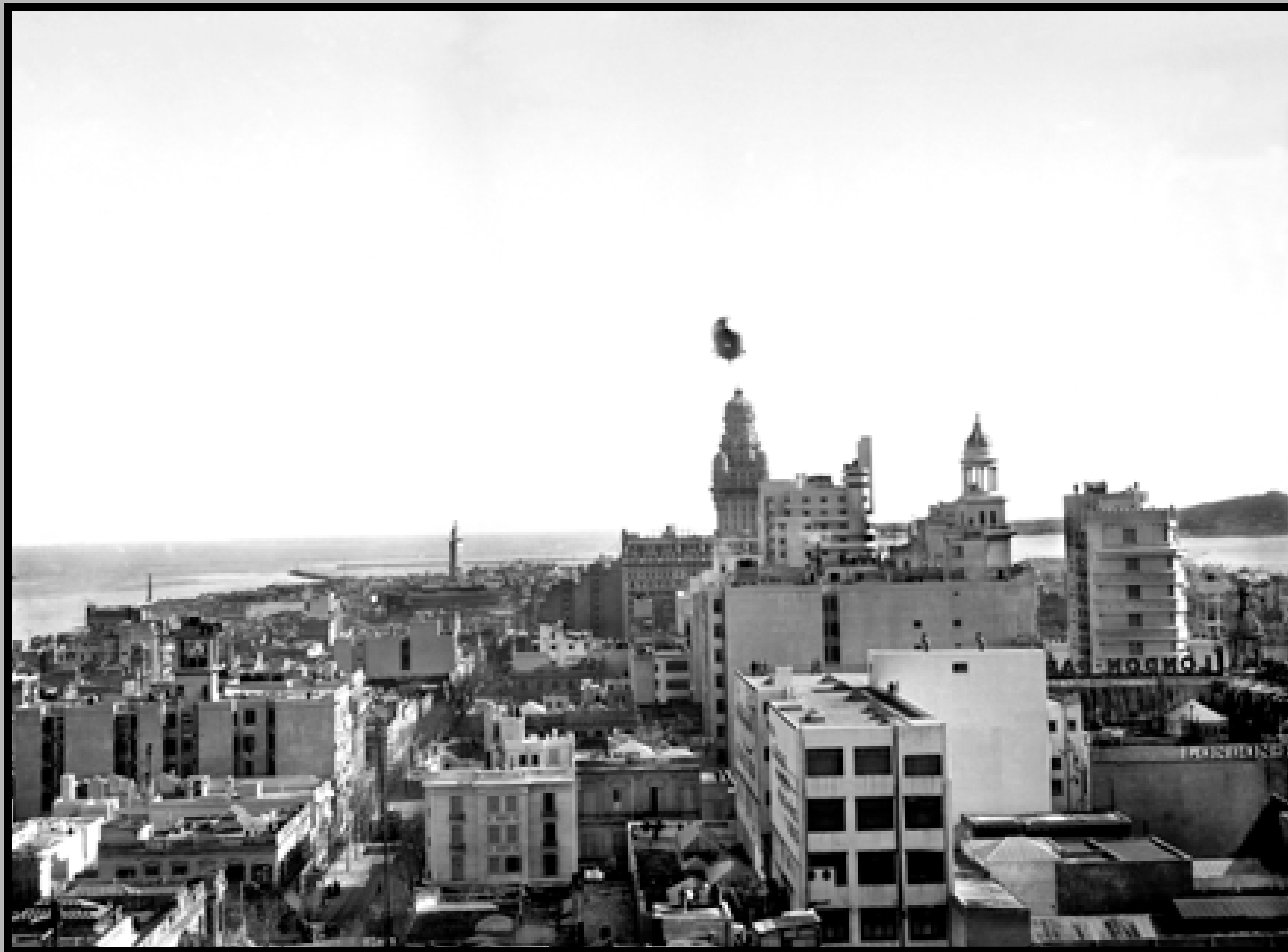
Pasaje del dirigible Graf Zeppelin por los barrios Centro y Ciudad Vieja. Al centro: Palacio Salvo. Junio - julio de 1934.