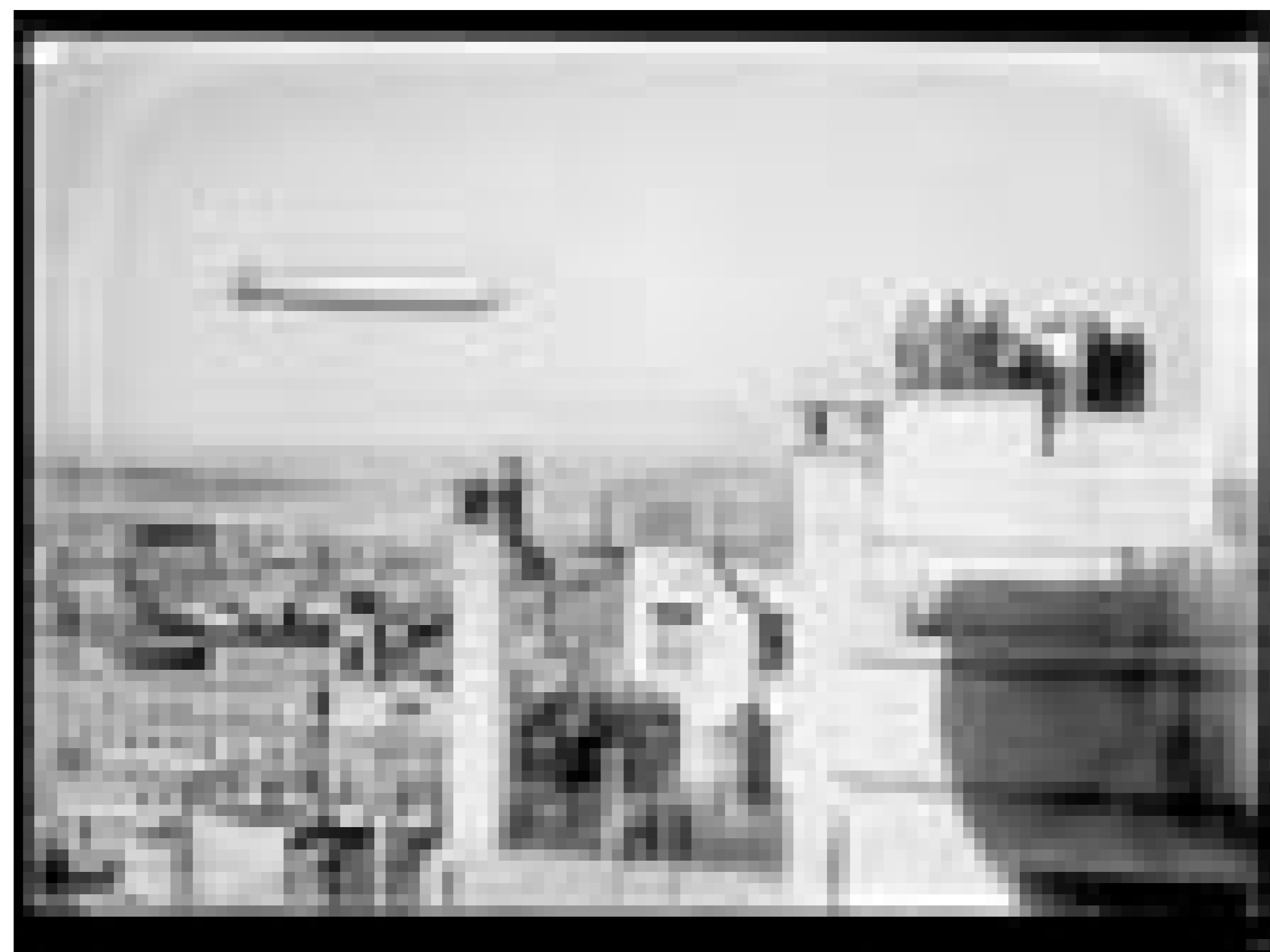
Dirigible Graf Zeppelin. A la izquierda: Colegio Sagrado Corazón de Jesús (Seminario).

Más de 2.000 fotografías históricas pertenecientes al acervo del CdF disponibles en: http://cdf.montevideo.gub.uy/catalogo