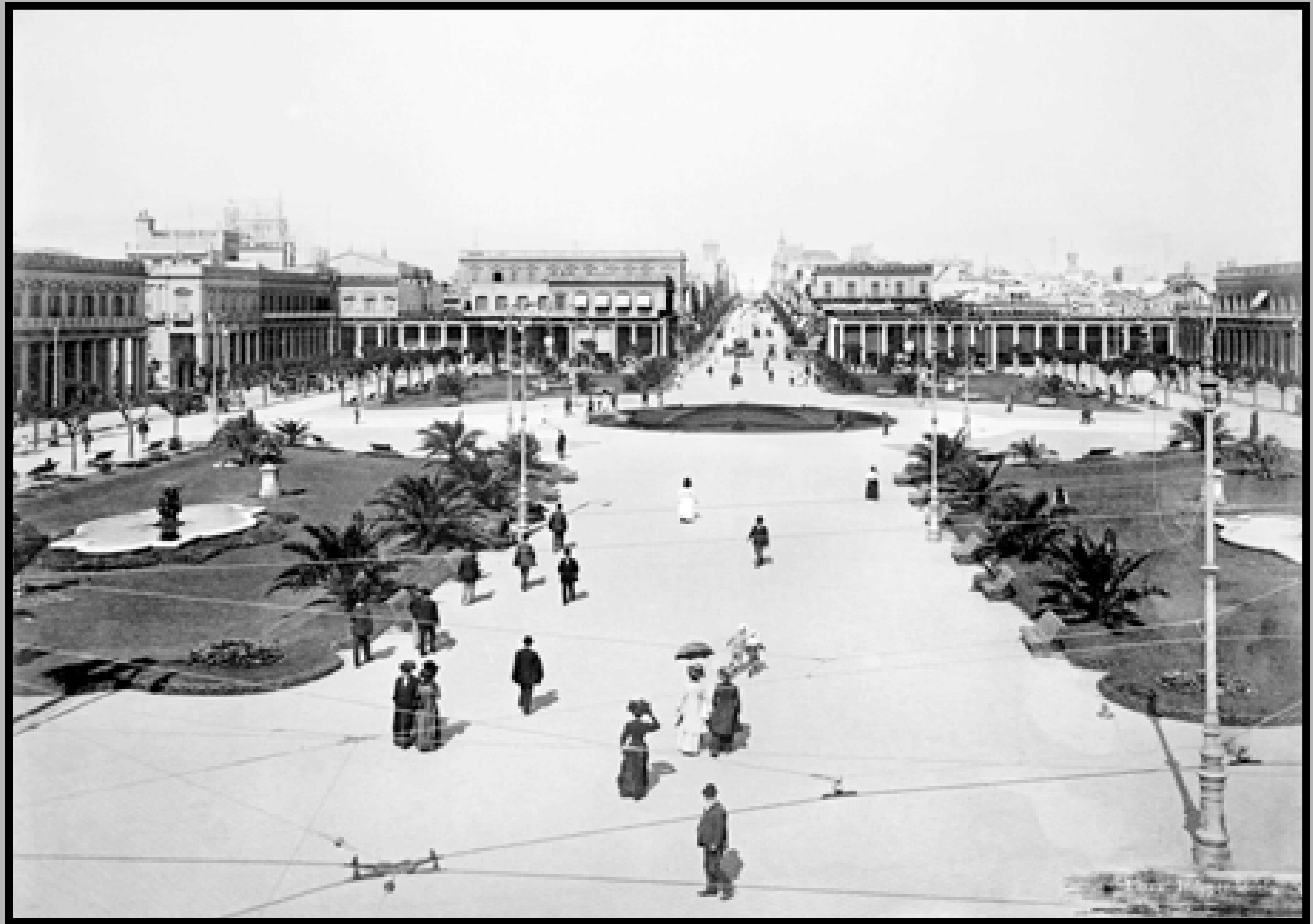
Plaza Independencia. Al fondo: avenida 18 de Julio. A la derecha: café y confitería La Giralda. Reproducción de copia fotográfica. Año 1910. (Foto: 0972FMHB.CDFIMO.UY - Autor: S.d./IMO).