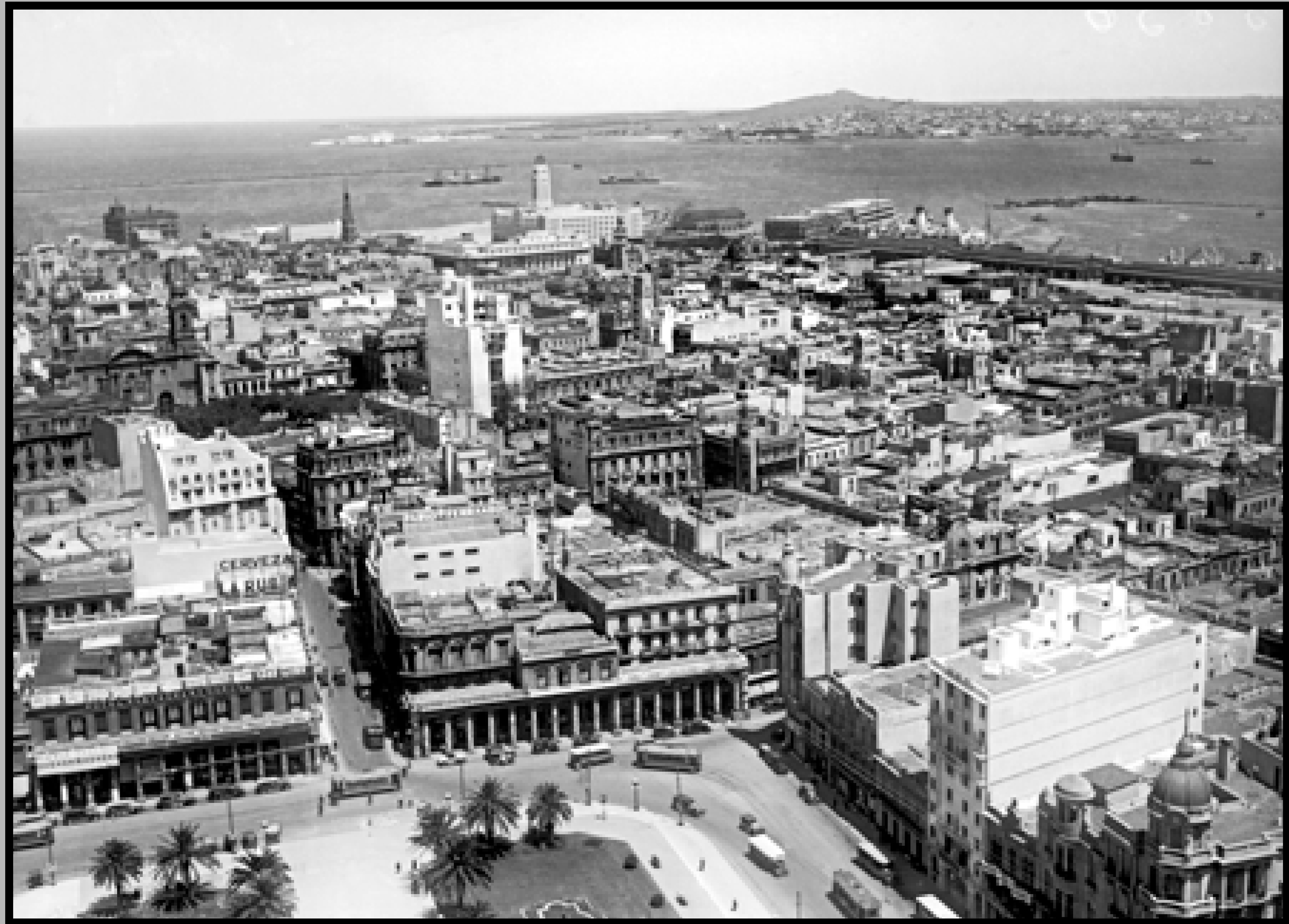
Vista parcial de la Ciudad Vieja. Toma efectuada desde el Palacio Salvo. Año 1932 (aprox.). (Foto: 05836FMHGE.CDFIMOUY - Autor: S.d./IMO).