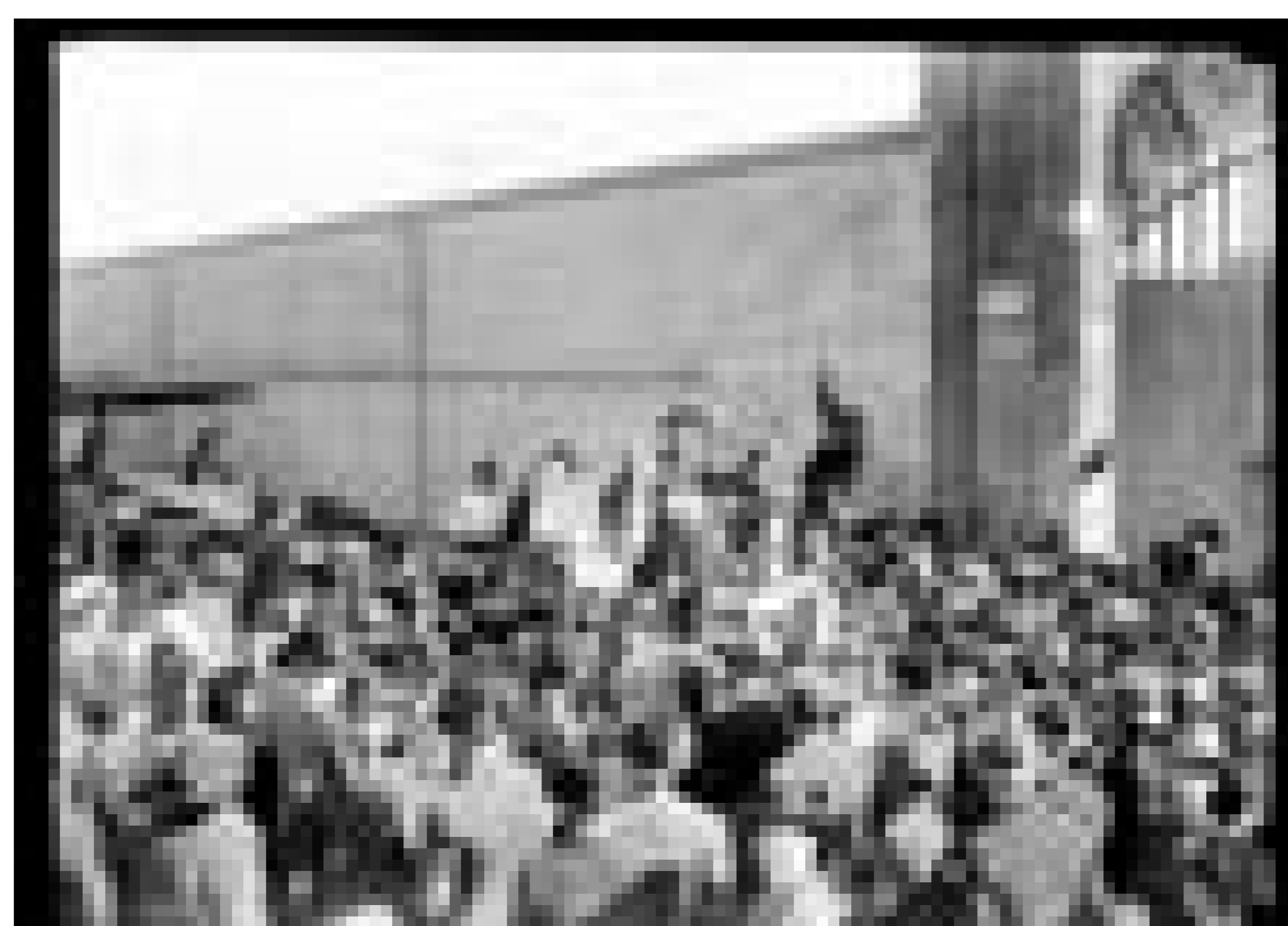
Feria de la calle Yaro, actual Tristán Narvaja. Calle Colonia.

Fecha: Año 1867 (aprox.). Productor: Intendencia Municipal de Montevideo Autor: S.d. Código de referencia: 0029FMHB Soporte: Vidrio Técnica Fotográfica: Gelatina y plata