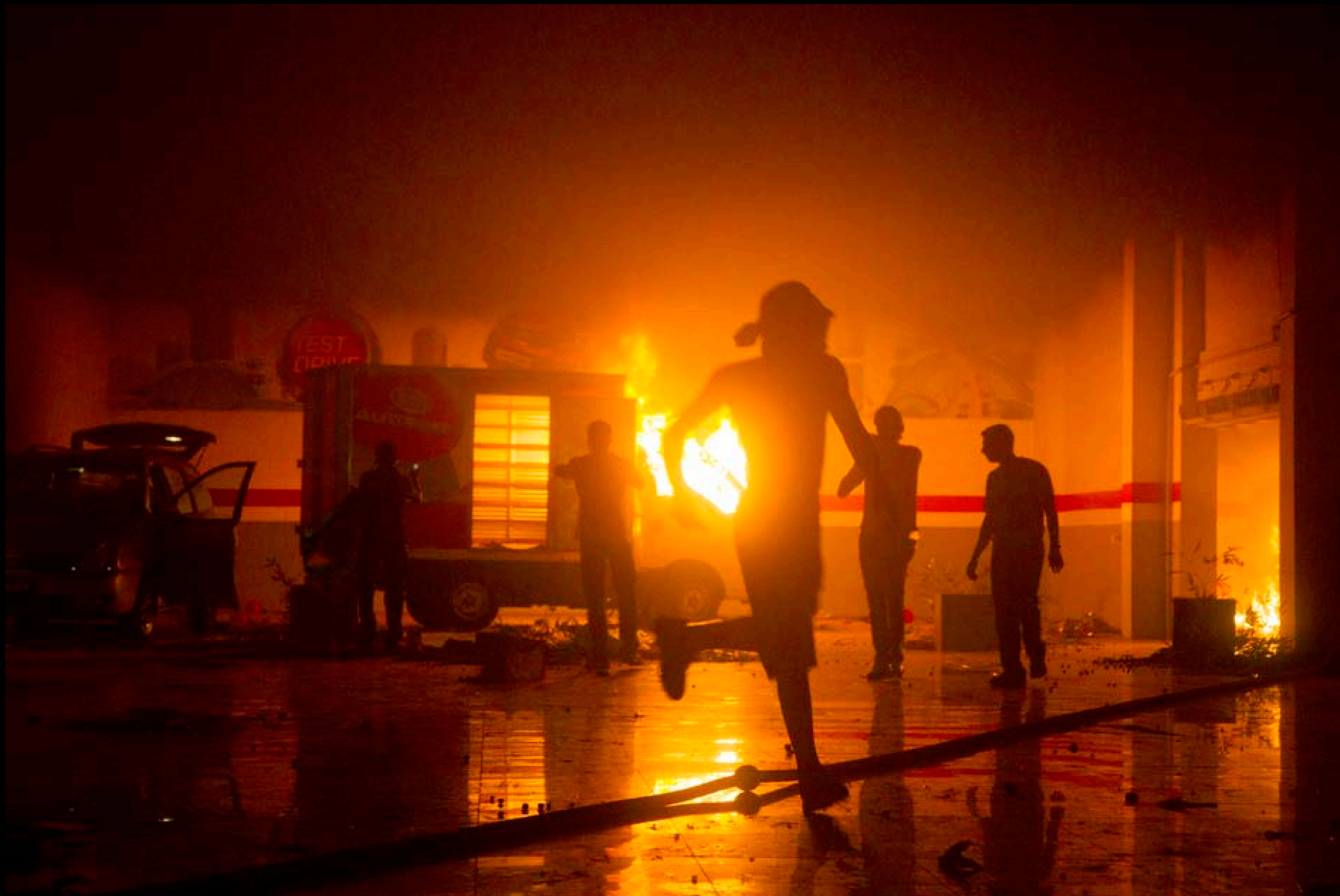
El campo era una ex guerra Brasil vs. Uruguay.