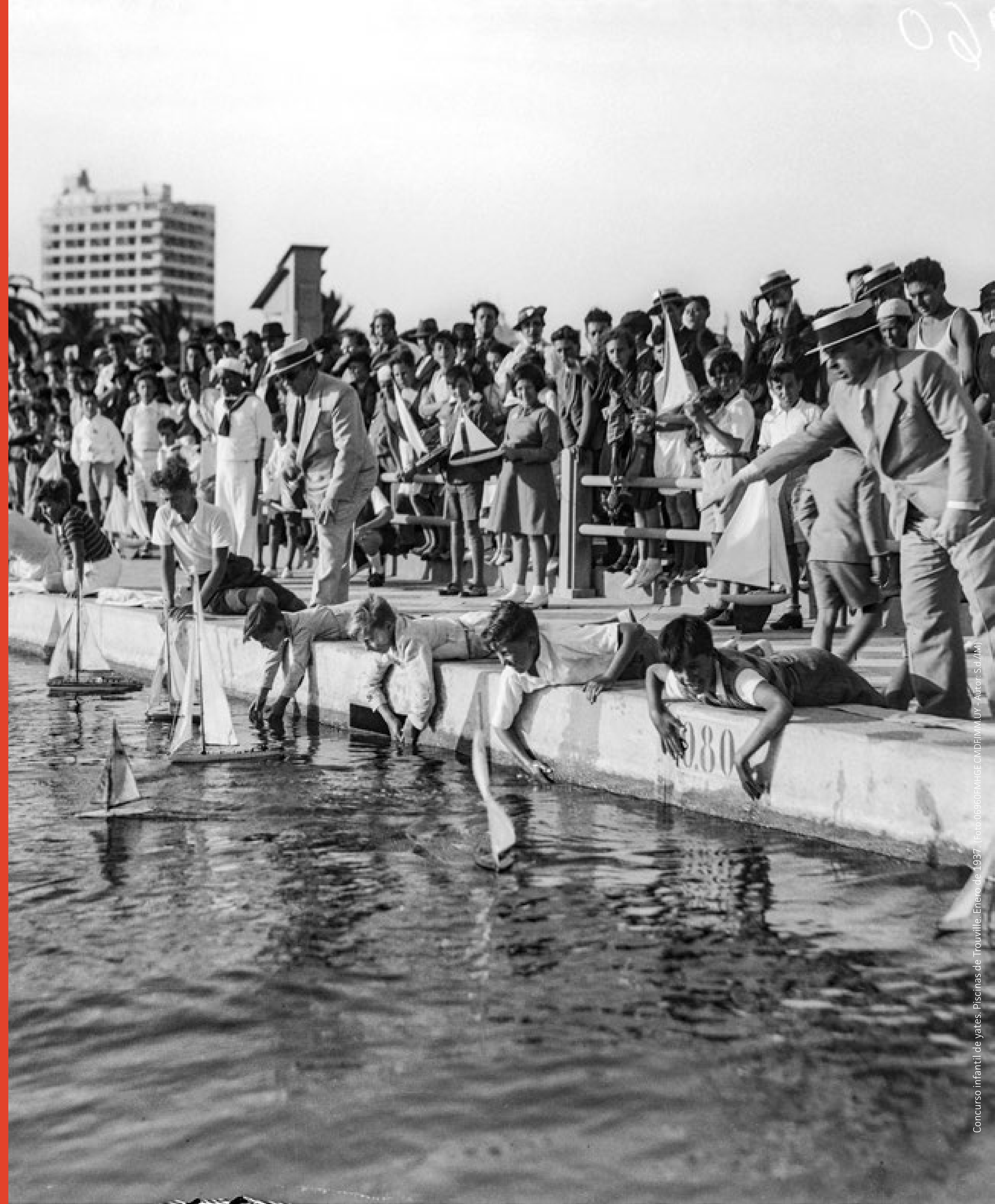
Concurso infantil de Yates, Piscinas de Trouville, Enero de 1937.