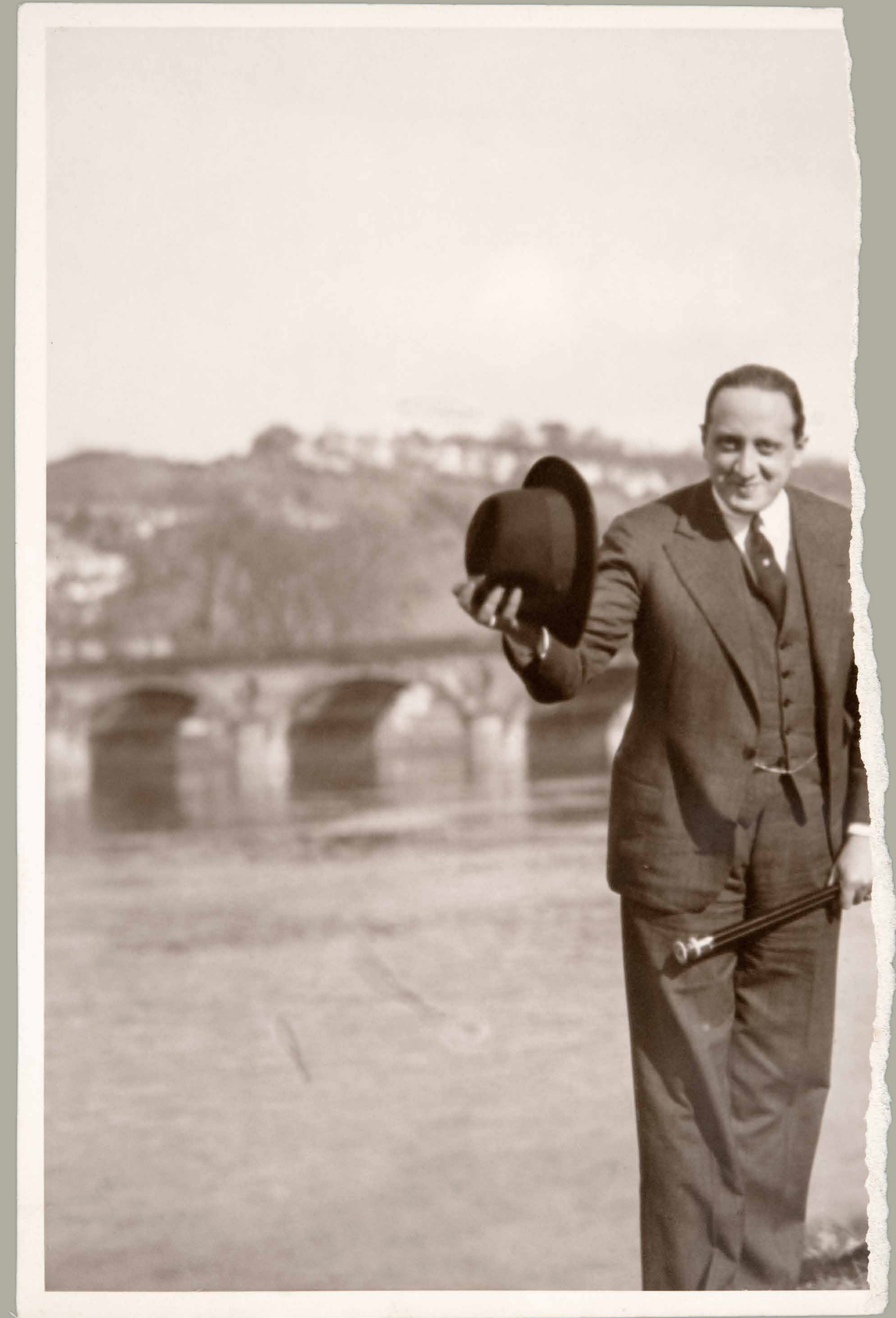
Gerardo Matos Rodríguez. Francia. Década de 1920.