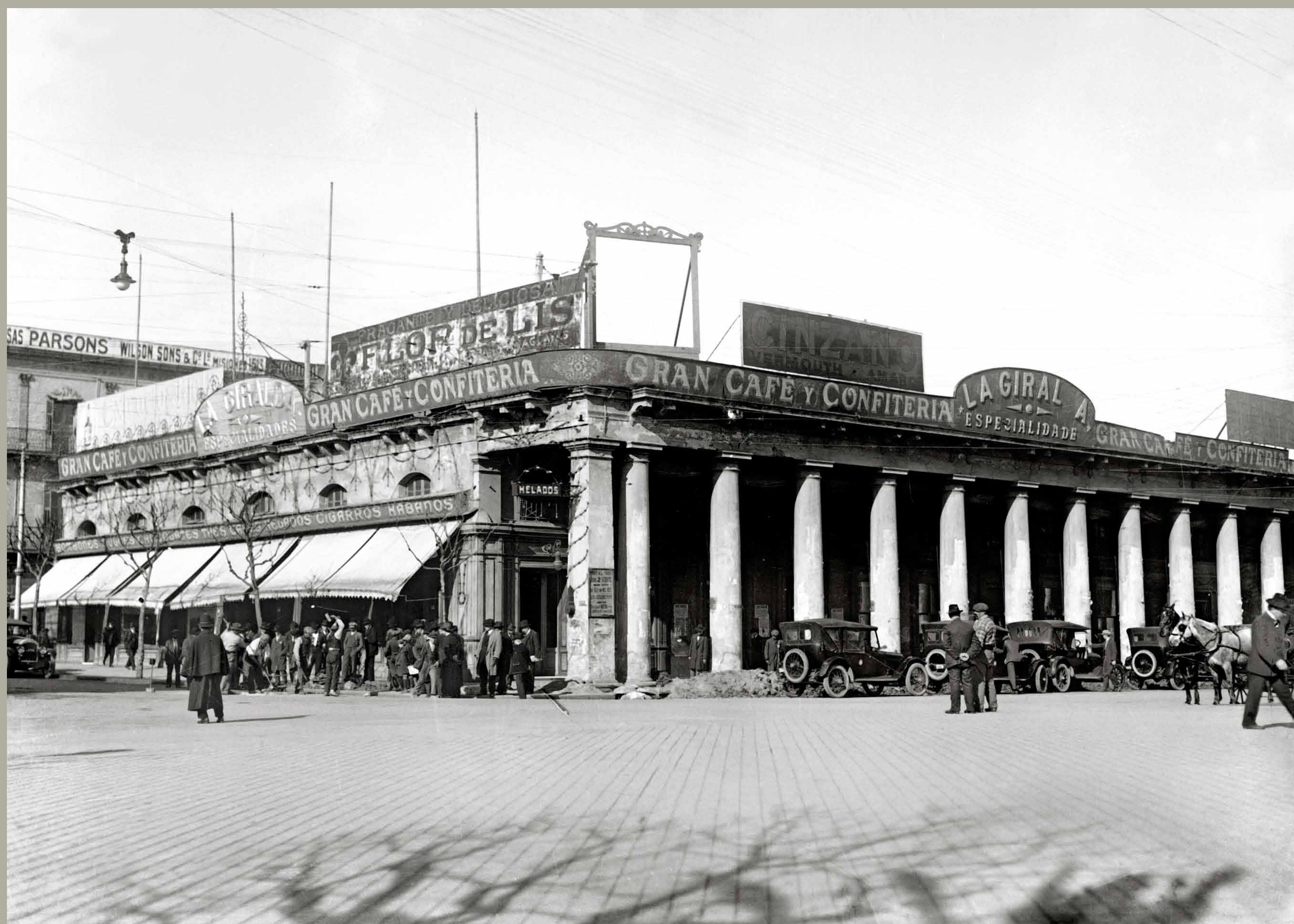
Café y Confeitería La Giralda. Esquina de la Avenida 18 de Julio y la Plaza Independencia. Año 1920 (aprox.). (Foto: 126FMHB.CDFIMO.UY - Autor: S.d./IMO).