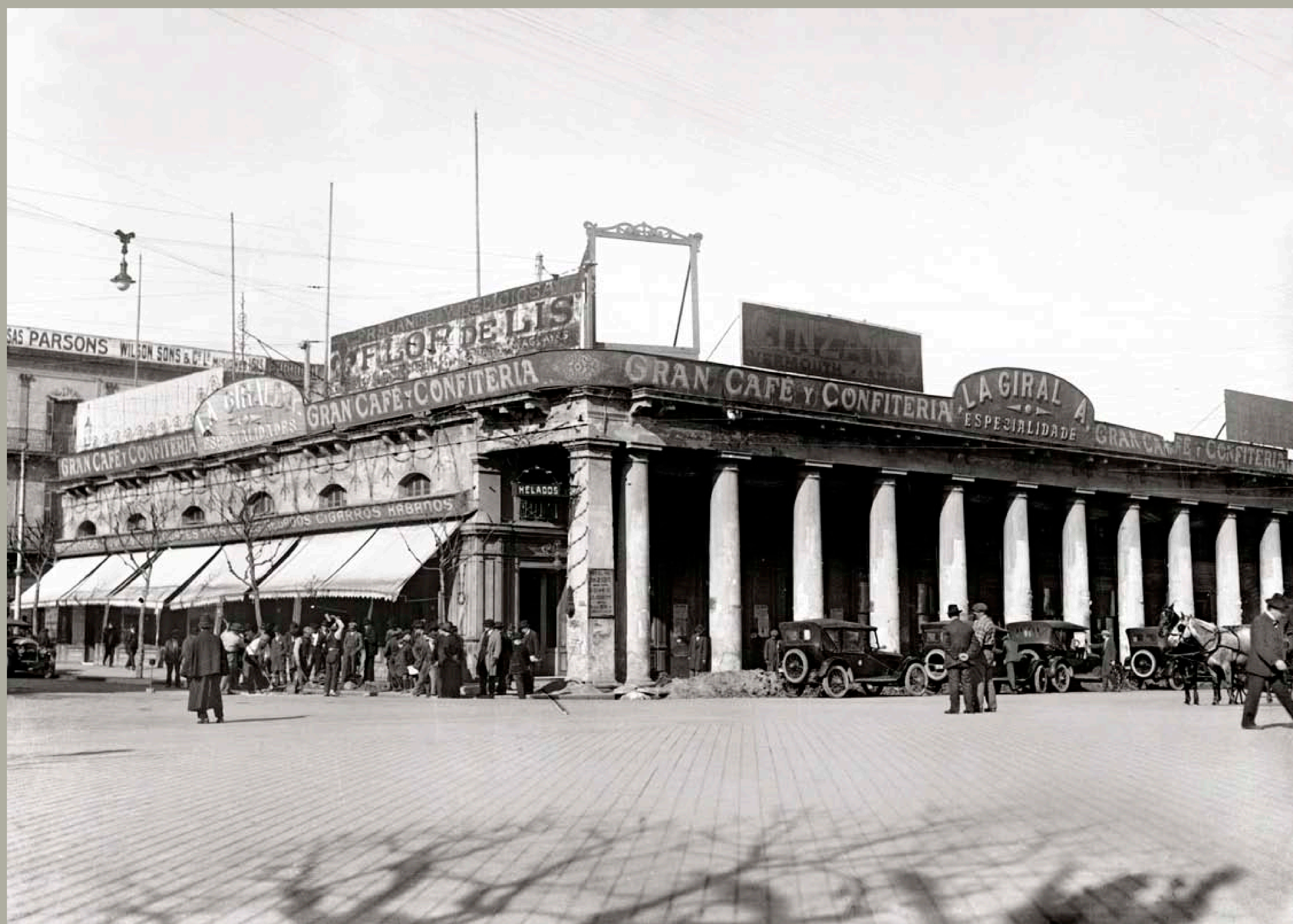
Café y Confeitería La Giralda. Esquina de la Avenida 18 de Julio y la Plaza Independencia. Año 1920 (aprox.). (Foto: 126FMHB.CDFIMO.UY - Autor: S.d./IMO).