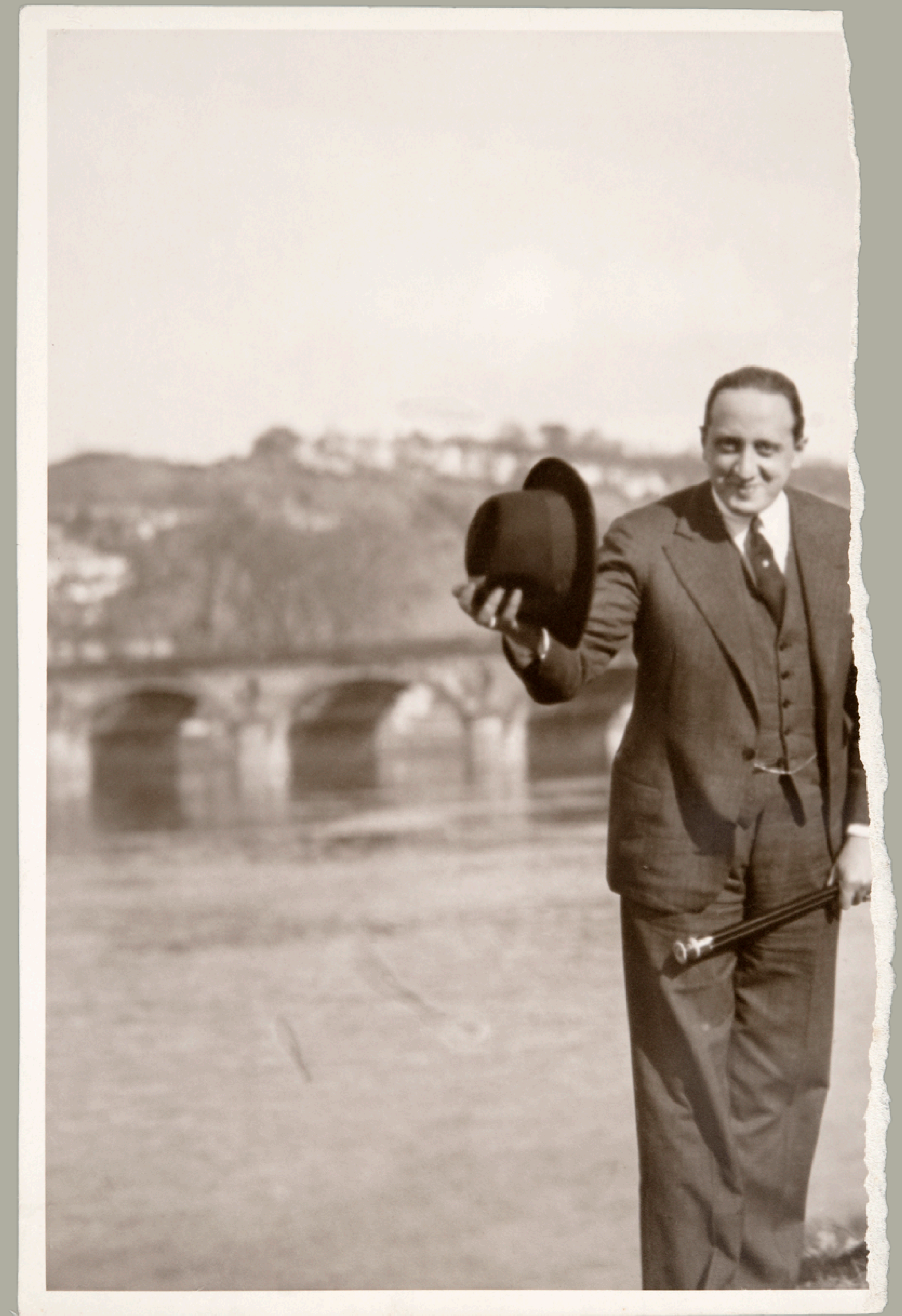
Gerardo Matos Rodríguez. Francia. Década de 1920.