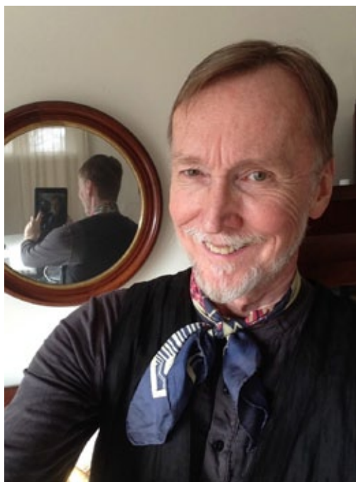
Grant Romer.