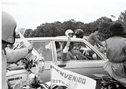
Llegada del exilio de Alfredo Zitarrosa. 31 de marzo de 1984. (Foto: 0009_42AFPCT.CDF. IMO.UY - Autor: fotógrafos de Camarates).

Alfredo Zitarrosa nació el 10 de marzo de 1936 en Montevideo. Vivió gran parte de su infancia en el interior. Fue locutor radial, y en su juventud se inició como periodista, colaborando, entre otras publicaciones, con el semanario Marcha . Escribió poemas y cuentos y su libro inédito Explicaciones ganó el Premio Municipal de poesía de 1959. En 1963 se inició como cantor y rápidamente alcanzó el reconocimiento popular, a lo que le siguieron presentaciones internacionales y una discografía numerosa; más de veinte discos editados principalmente en Uruguay, Argentina, España y México. Allí se destacan más de un centenar de obras como Guitarra Negra , El violín de Becho , Doña Soledad , Crece desde el pie , Milonga para una niña , Adagio en mi país y muchas más.