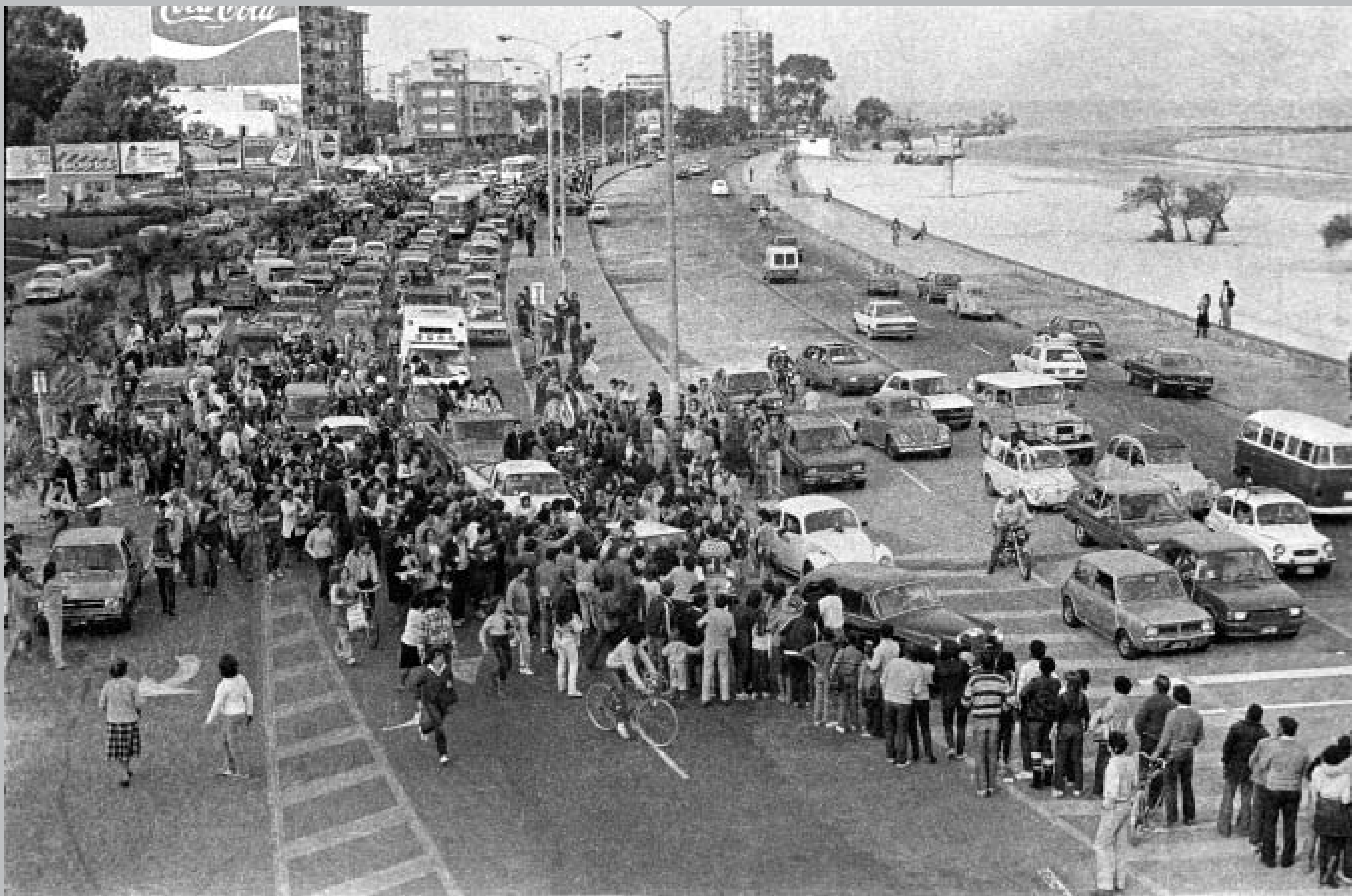
Caravana de bienvenida a Los Olimareños. Rambla República de Chile a la altura de Hipólito Yrigoyen. 18 de mayo de 1984.