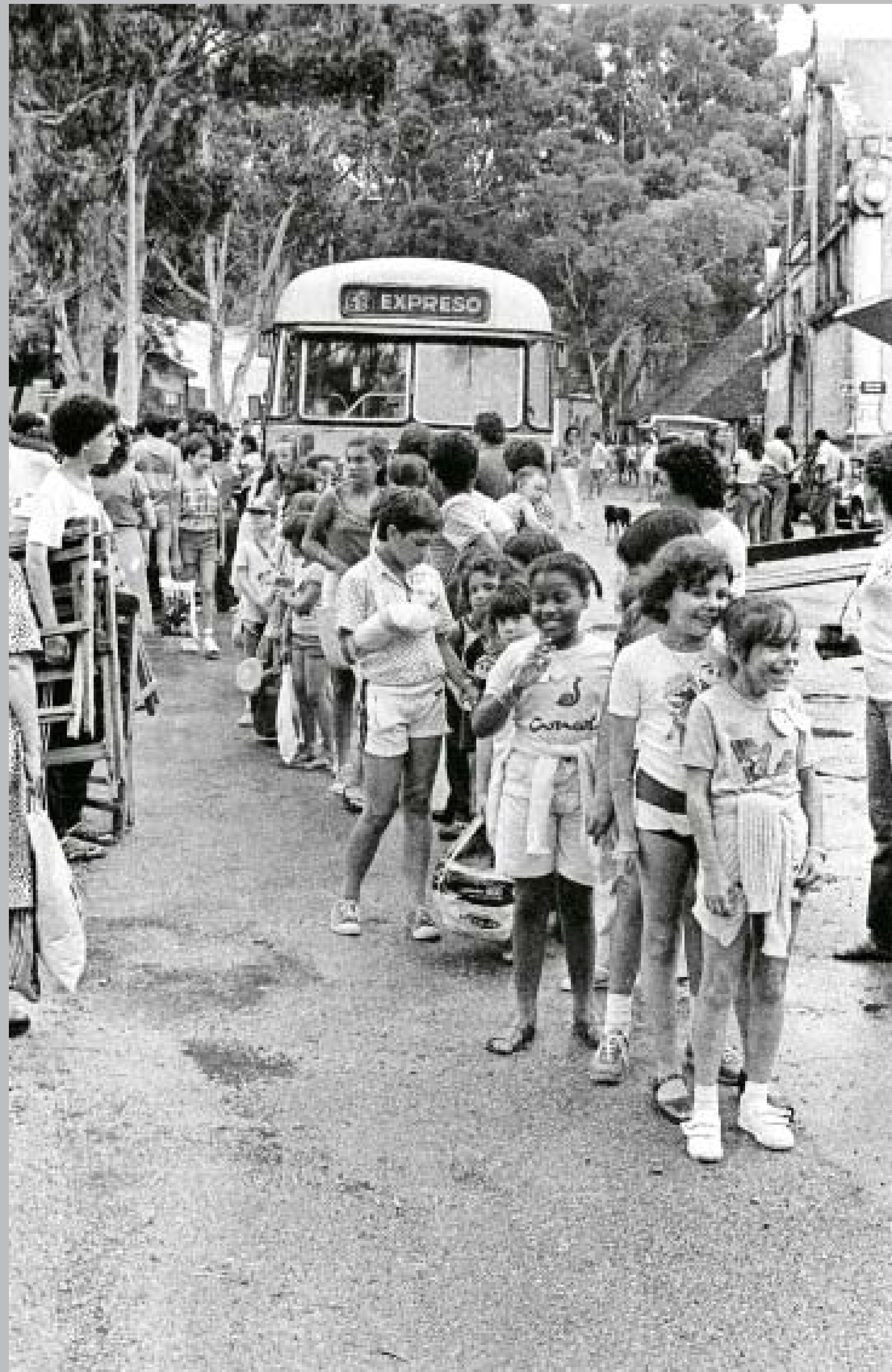
Hijos de uruguayos exiliados visitaron el país en el verano de 1983-1984. En la Rural del Prado se les da la bienvenida. Enero de 1984.