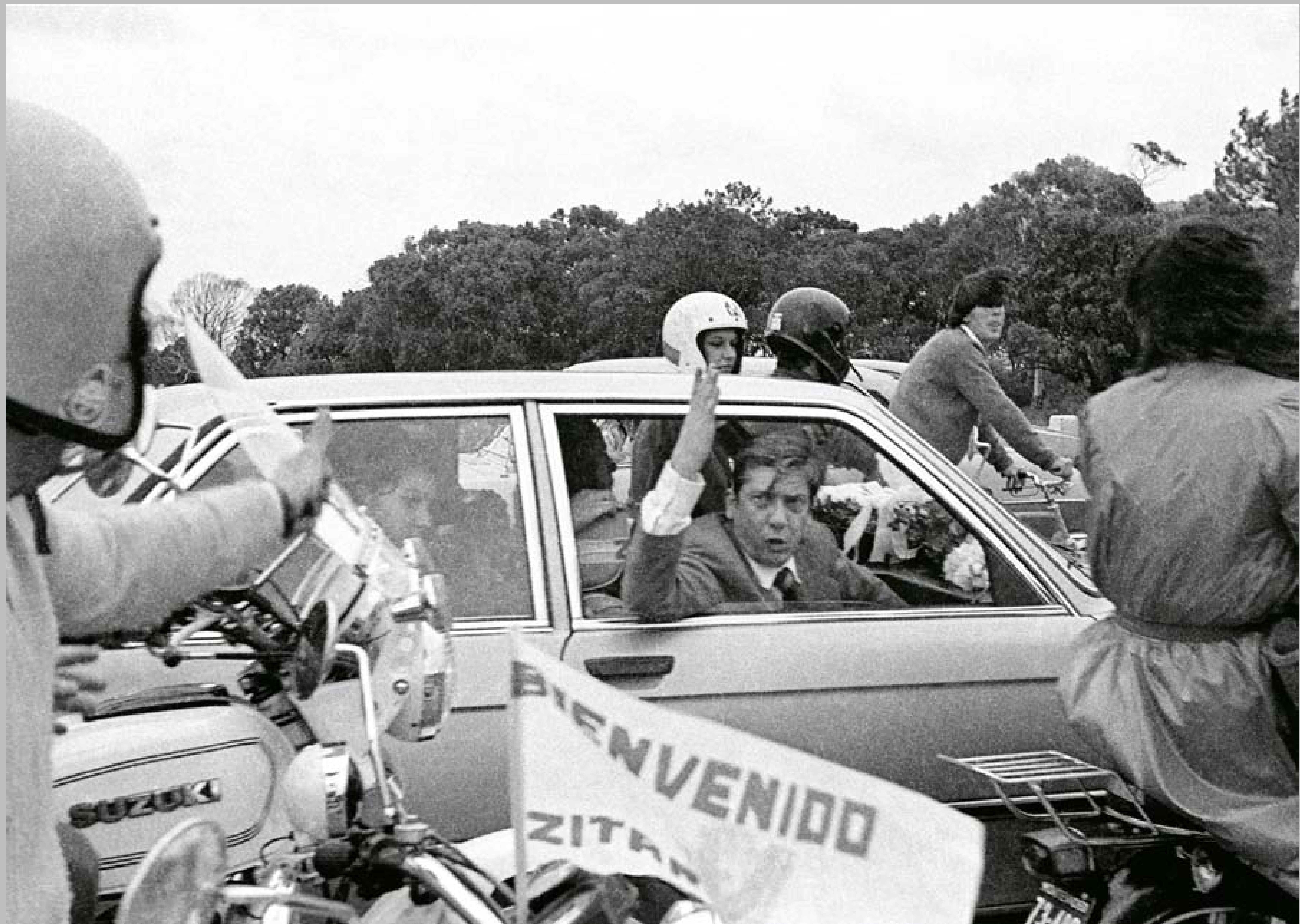
Llegada del exilio de Alfredo Zitarrosa. 31 de marzo de 1984.