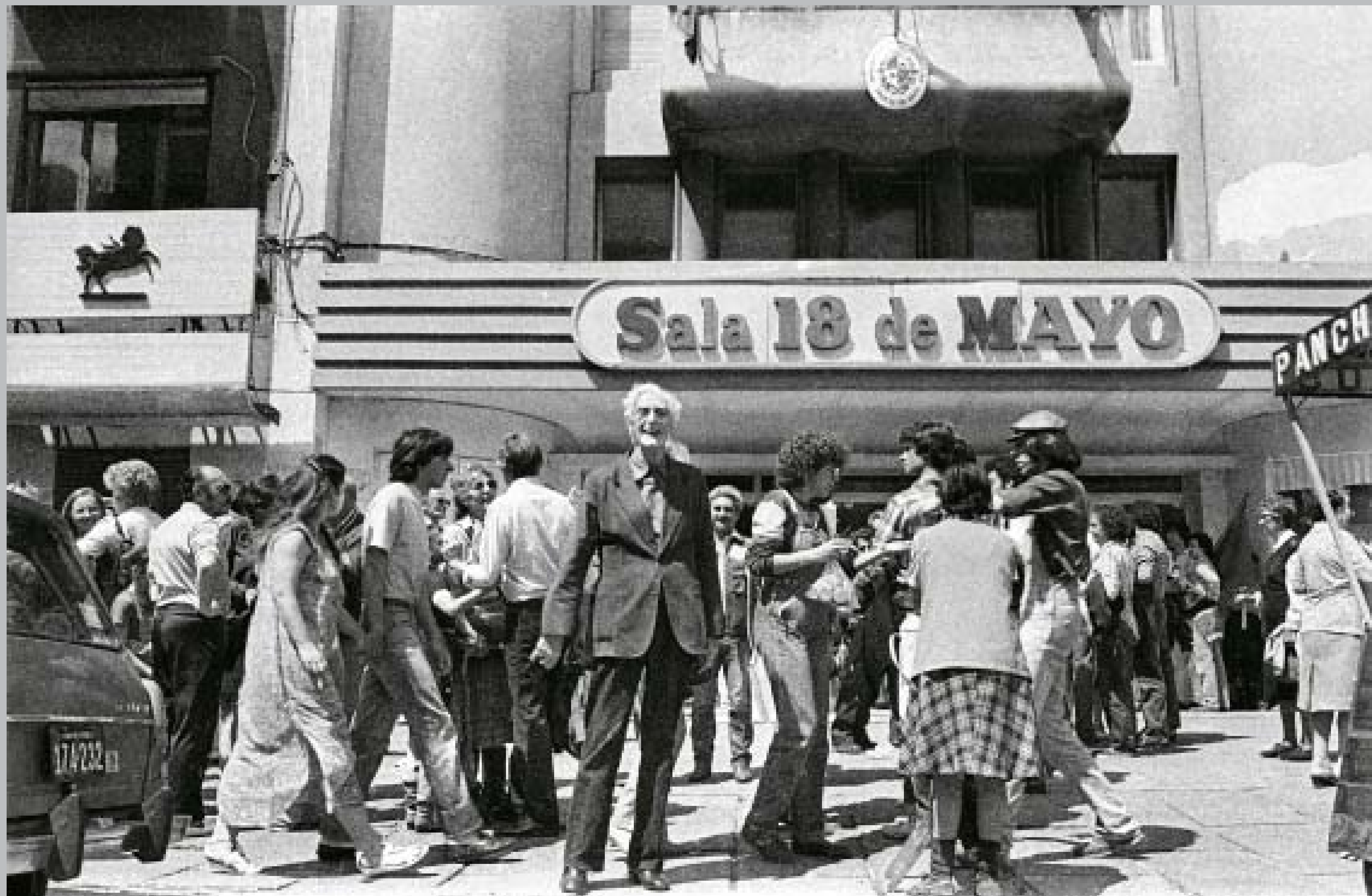
Concentración frente al teatro El Galpón con motivo del regreso de su elenco del exilio. Al centro: Atahualpa del Cioppo. Avenida 18 de Julio entre las calles Minas y Carlos Roxlo. 12 de octubre de 1984.