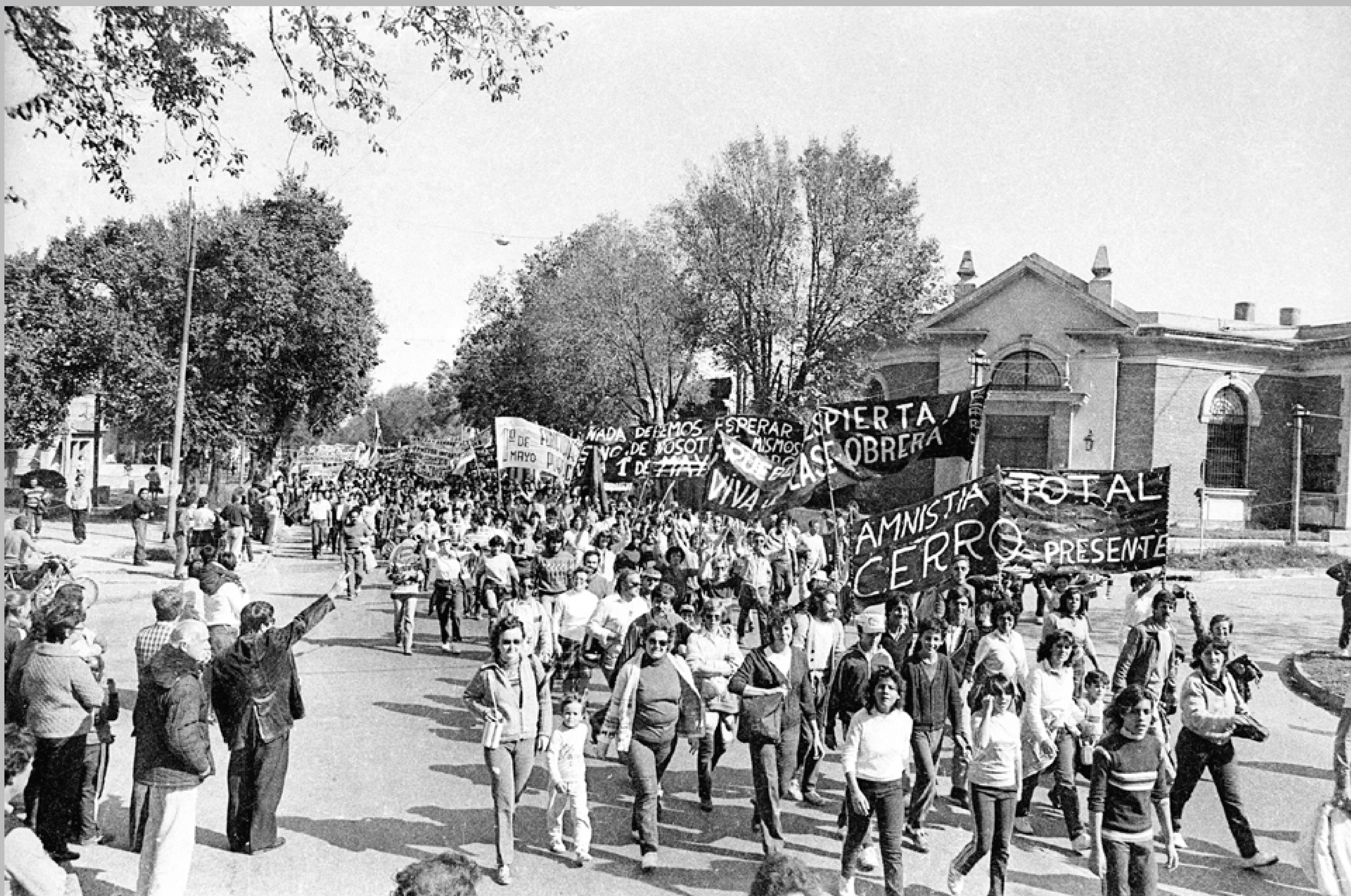
Movilización por la avenida Carlos María Ramírez hacia el acto en conmemoración del Día Internacional de los Trabajadores. Barrio Cerro. 1º de mayo de 1984.