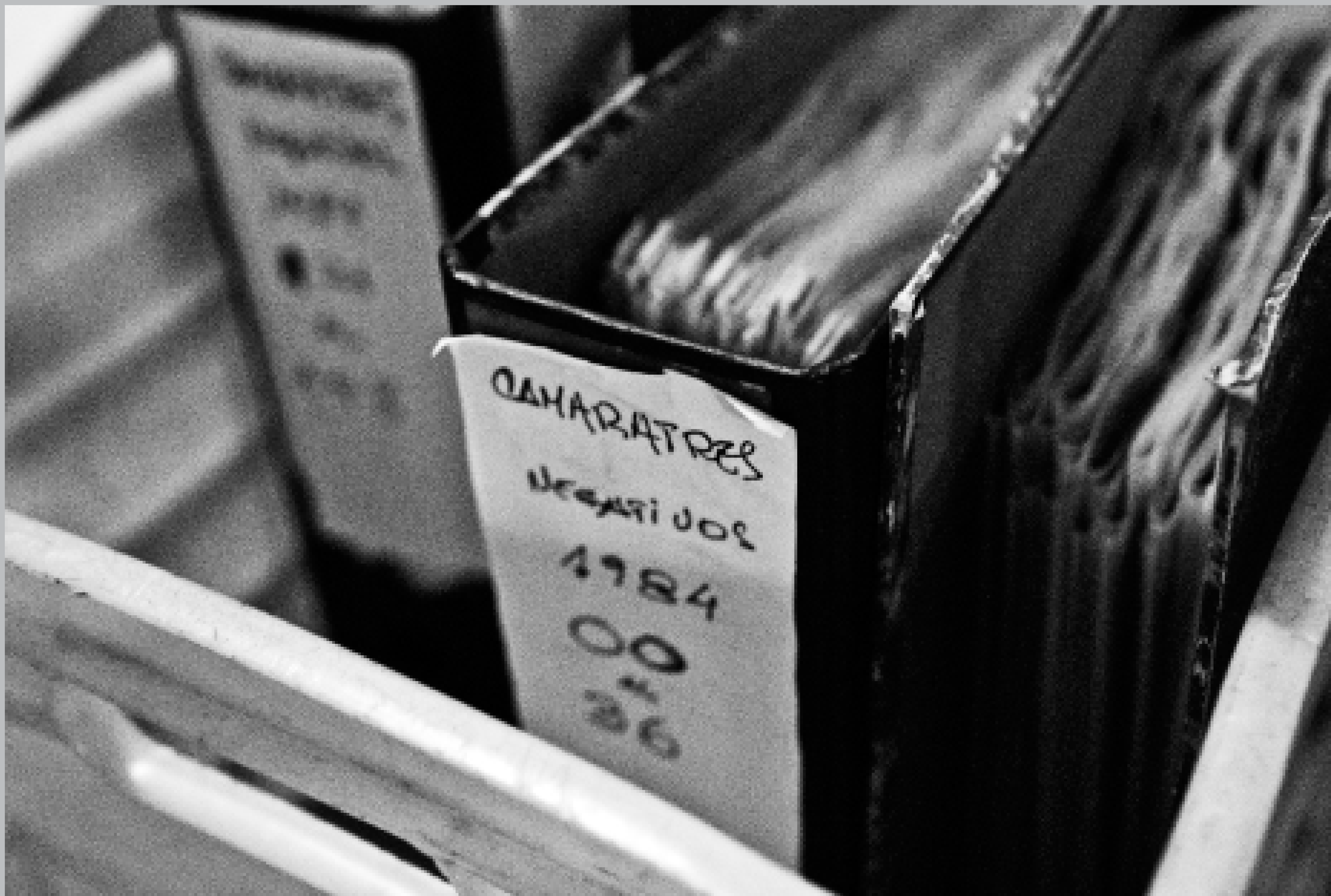
Bibliorato de negativos del archivo Camaratres . 20 de enero de 2015.