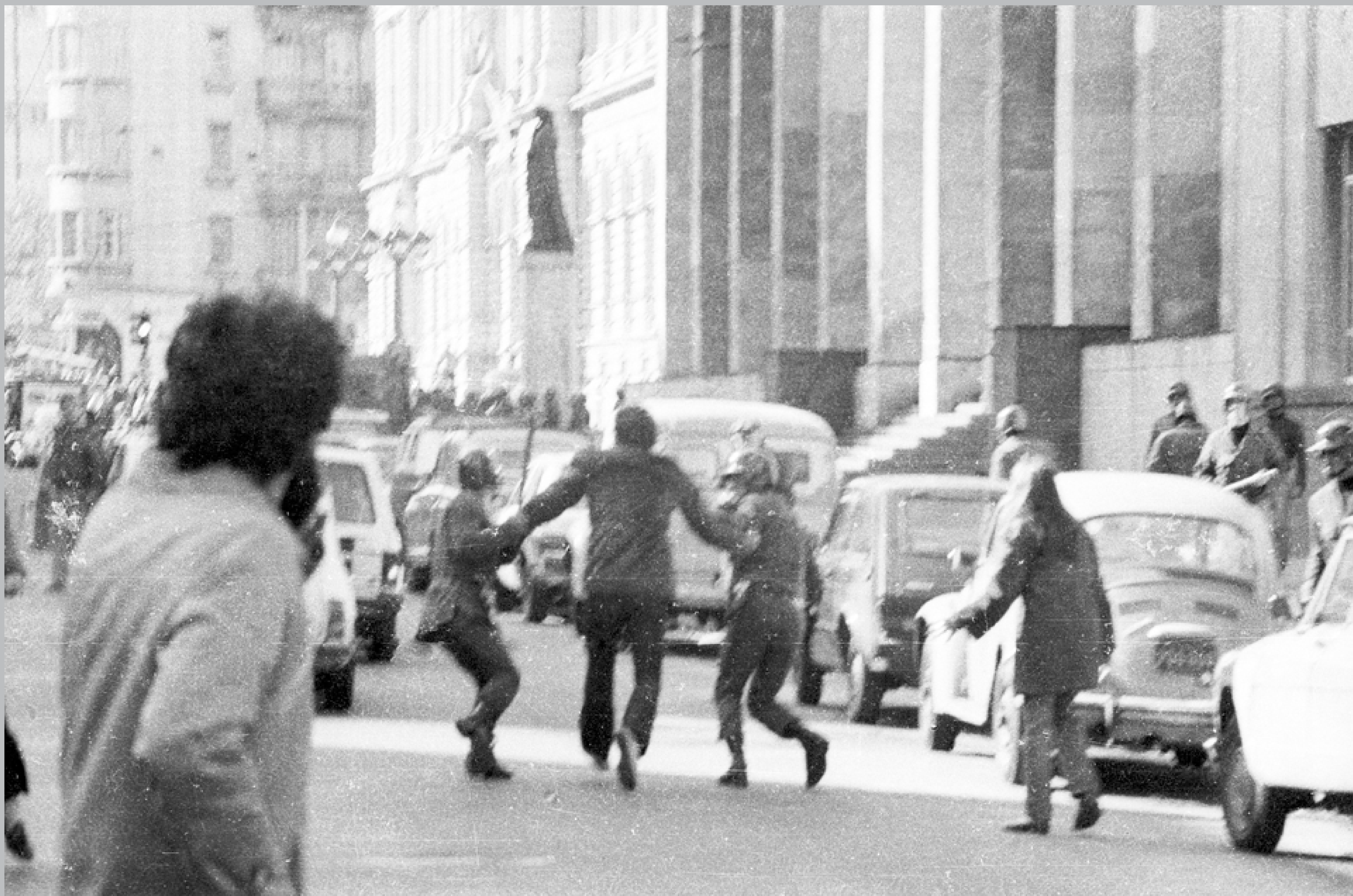
Represión de una manifestación antidictatorial. Avenida 18 de Julio y Tristán Narvaja. 3 de junio de 1984.