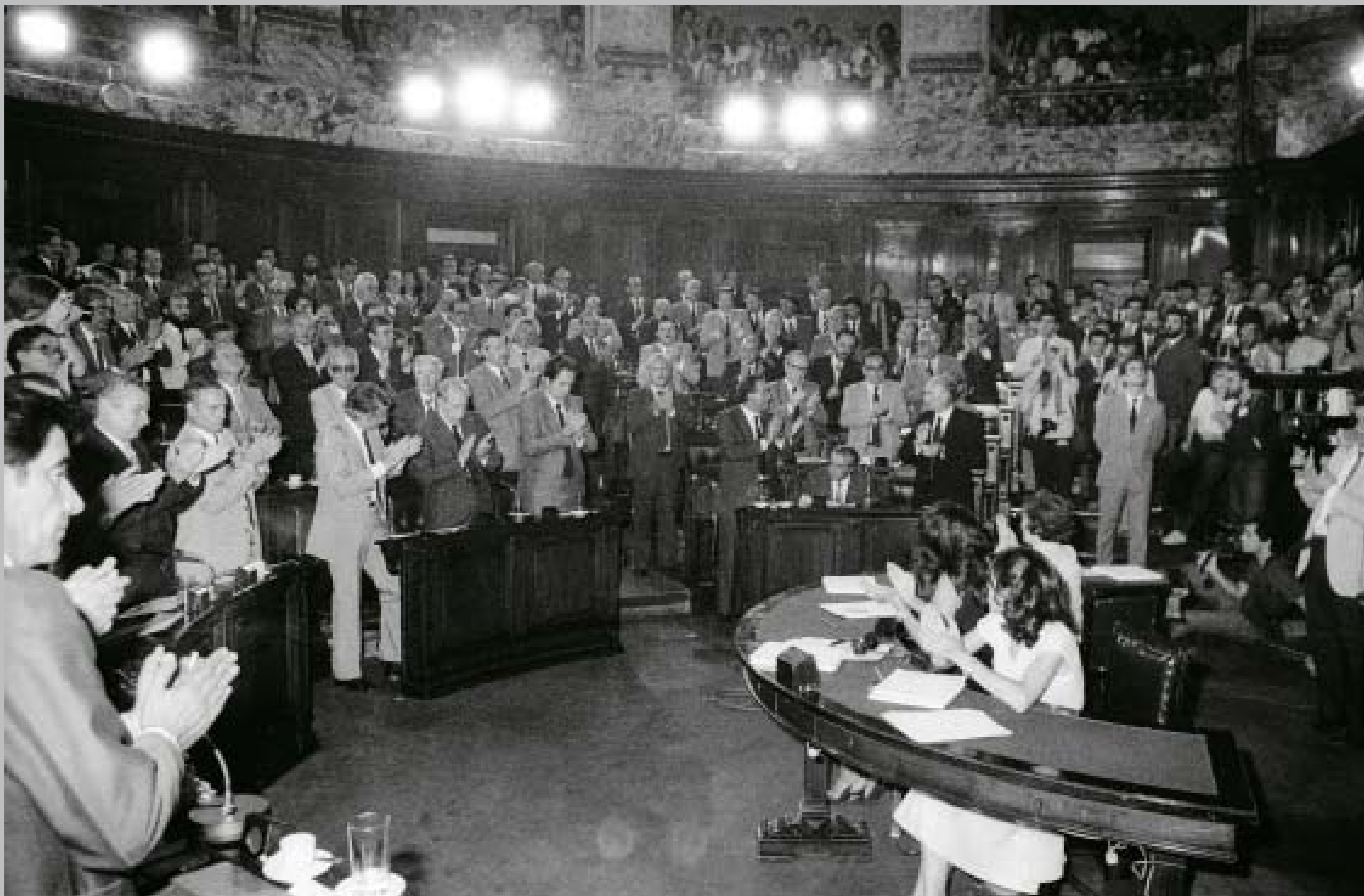
Asamblea General. Palacio Legislativo. 15 de febrero de 1985.