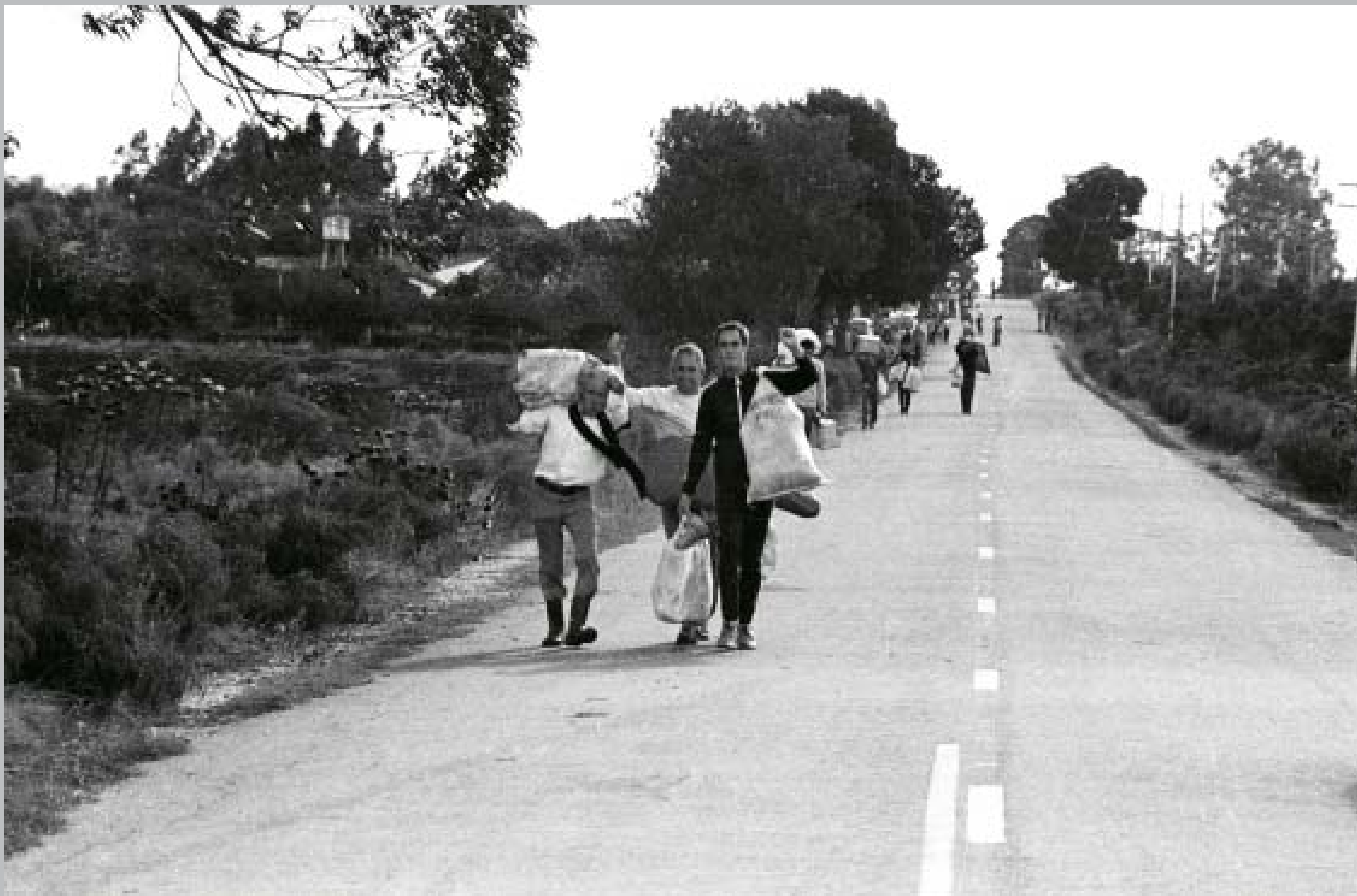
Liberación de los últimos presos del Penal de Libertad. Primeros días de marzo de 1985.