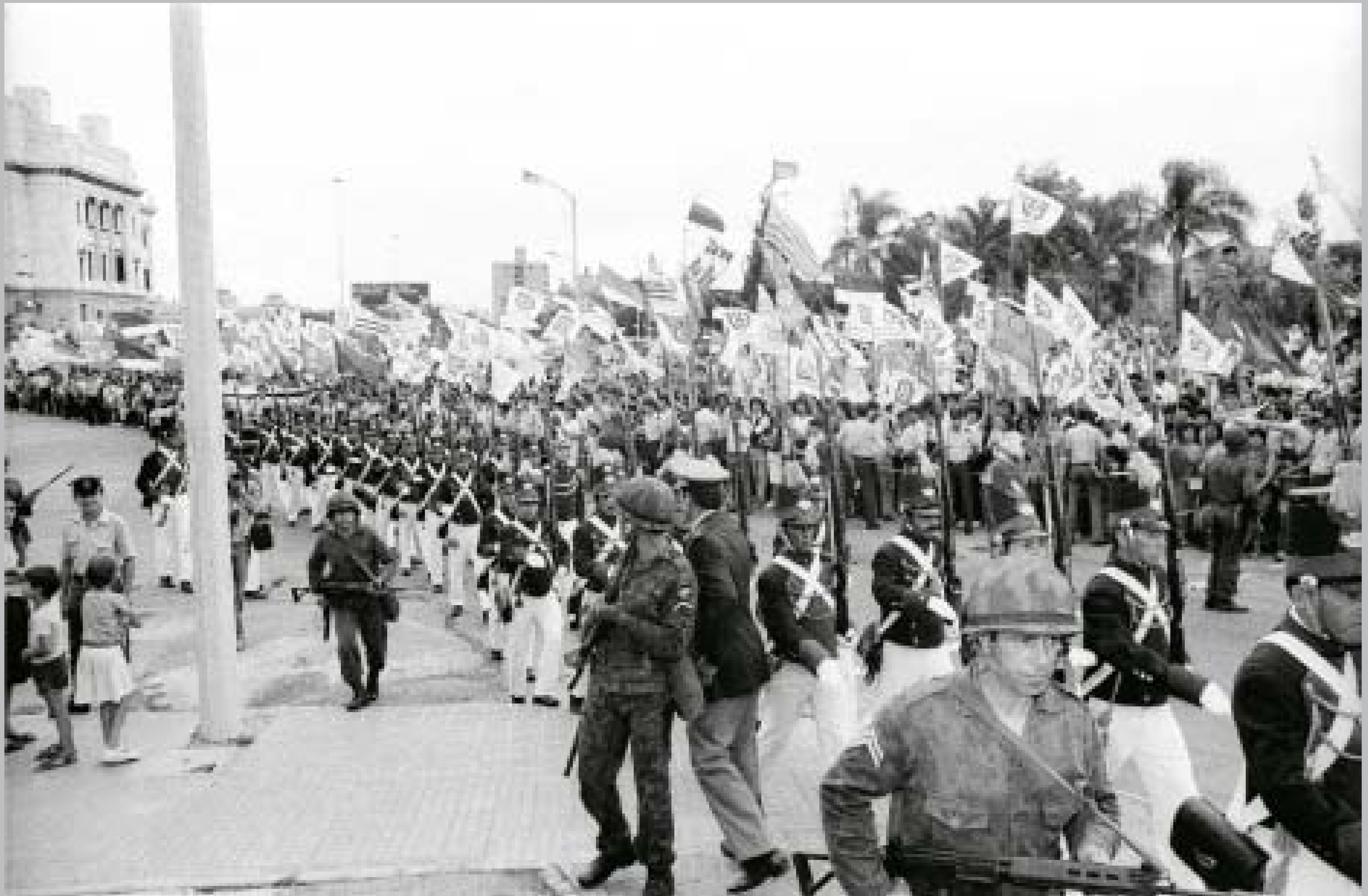
Inmediaciones del Palacio Legislativo. Desfile del Batallón Florida. 15 de febrero de 1985.