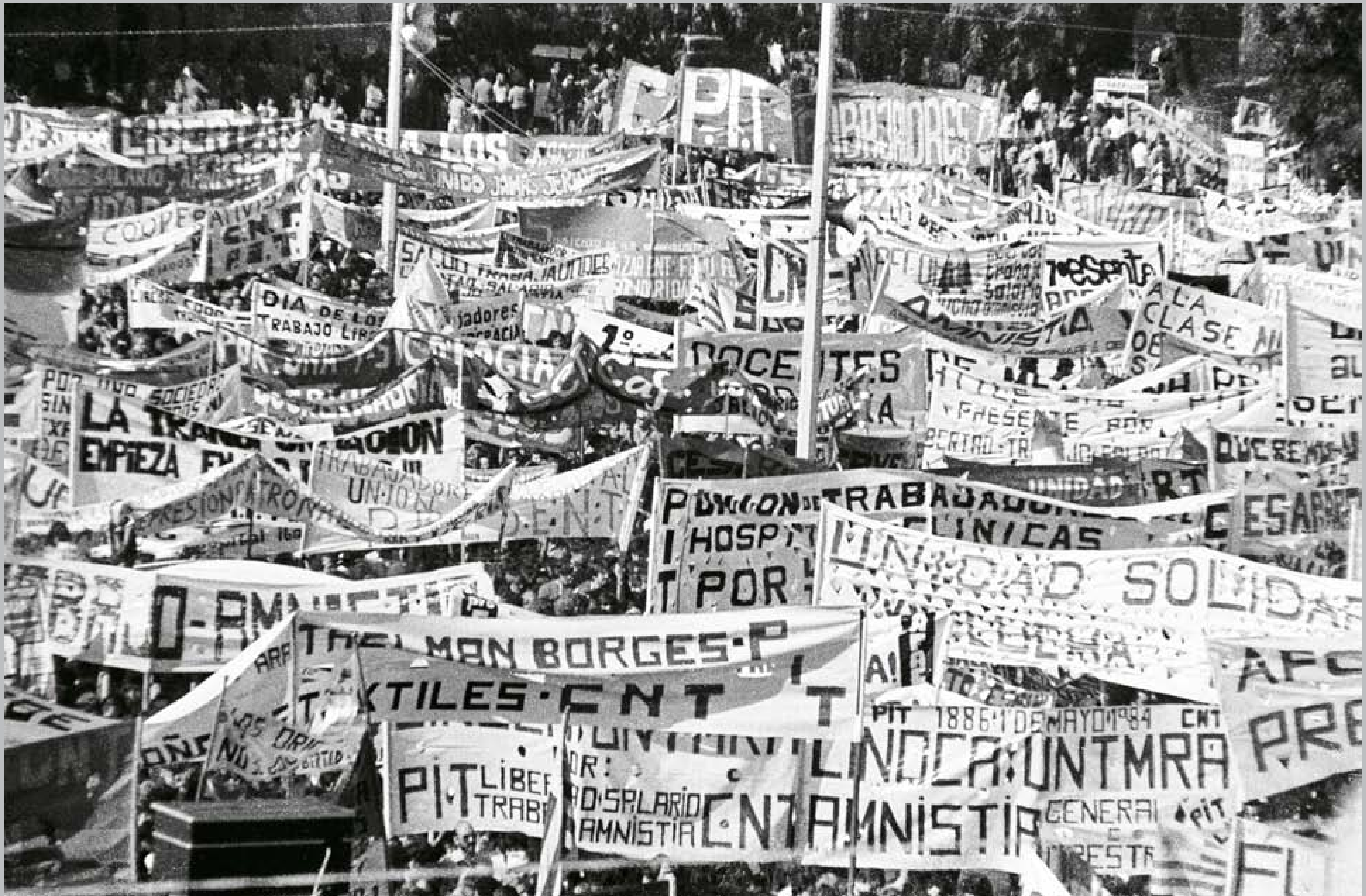
Acto en conmemoración del Día de los Trabajadores. Proximidades del Palacio Legislativo. 1º de mayo de 1984.