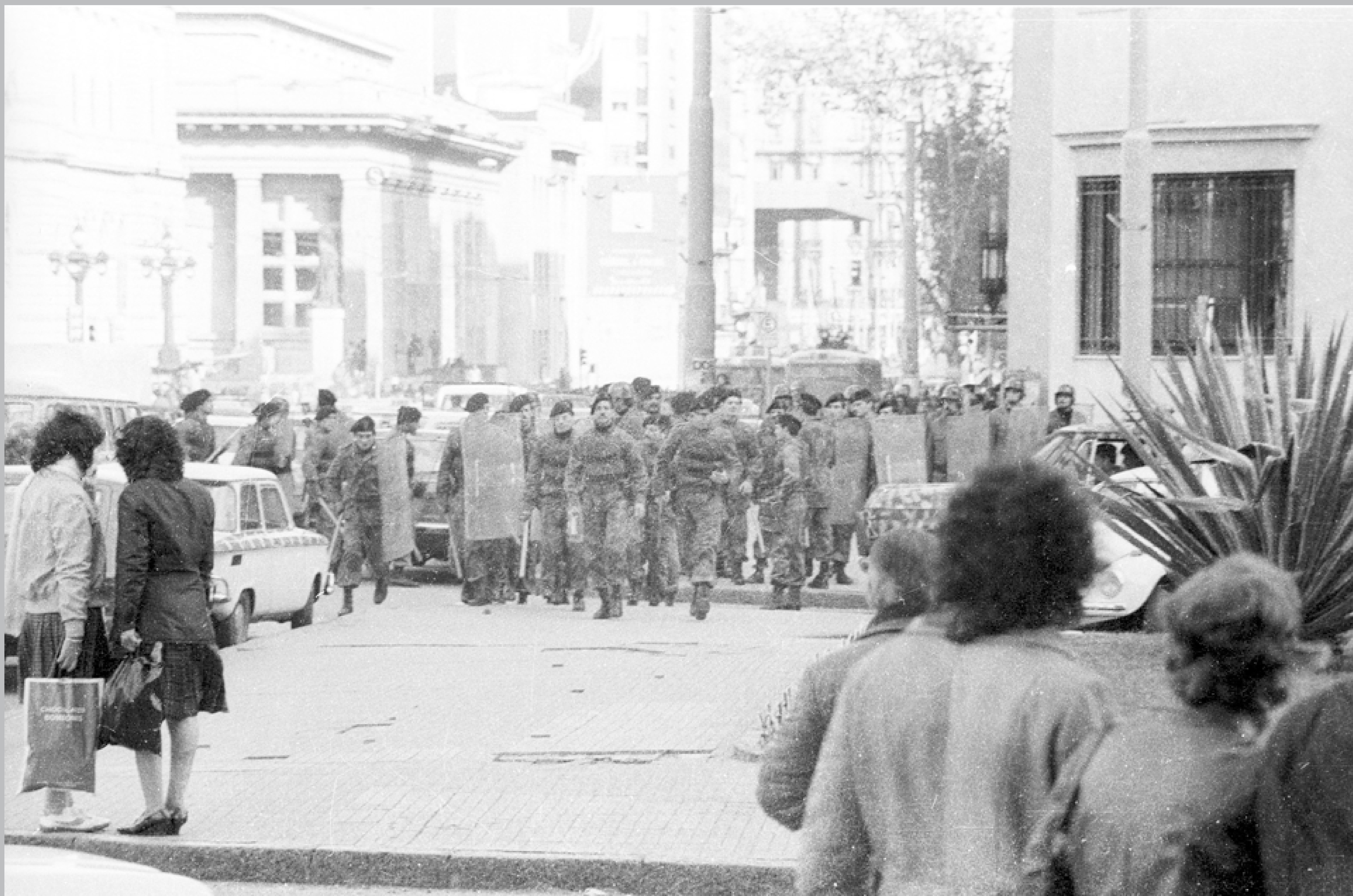
Represión de una manifestación antidictatorial. Avenida 18 de Julio y Tristán Narvaja. 3 de junio de 1984.