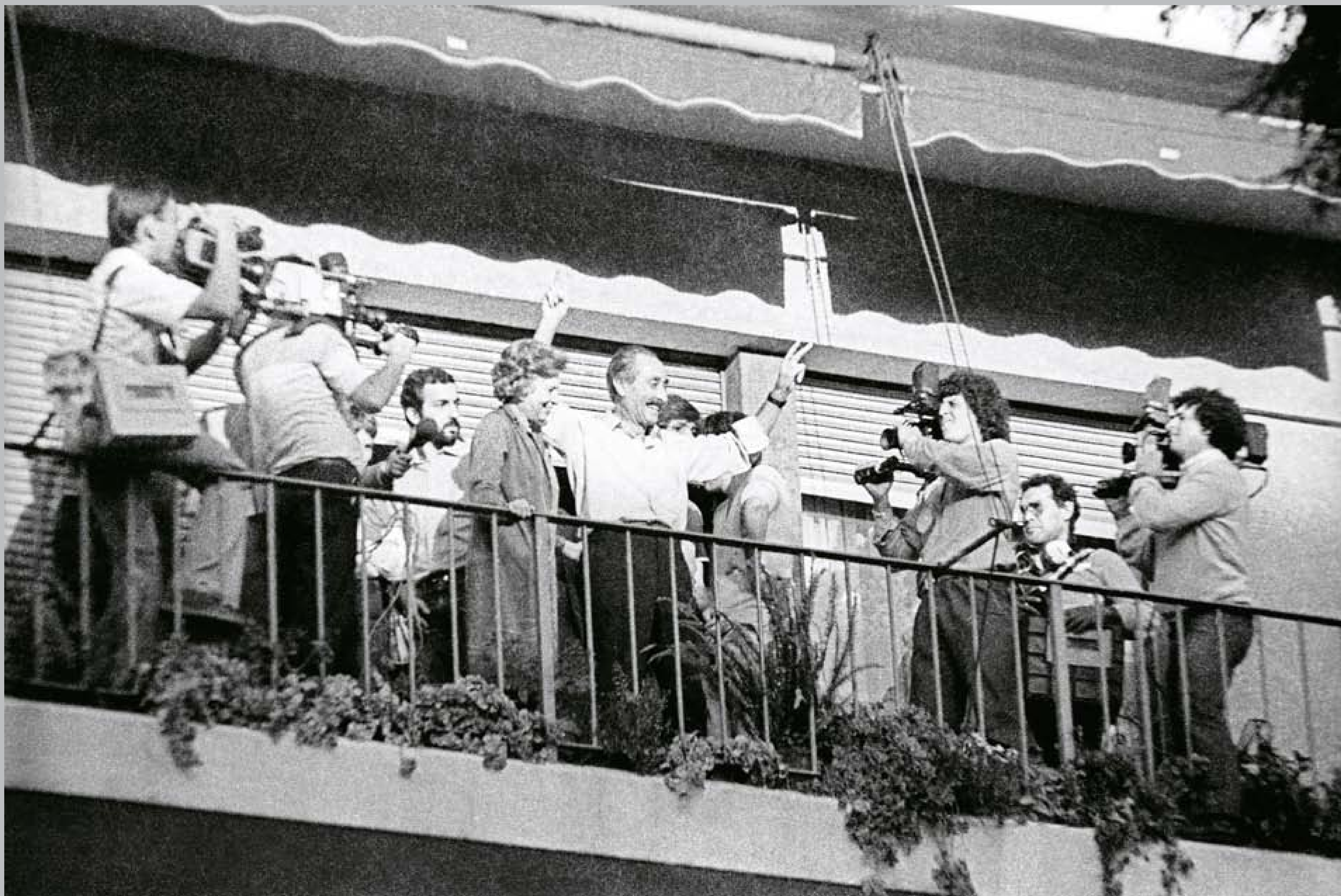
Liber Seregni y su esposa, Lilí Lerena, saludando en el balcón de su apartamento, ubicado en Bulevar Artigas y Bulevar España. 19 de marzo de 1984.