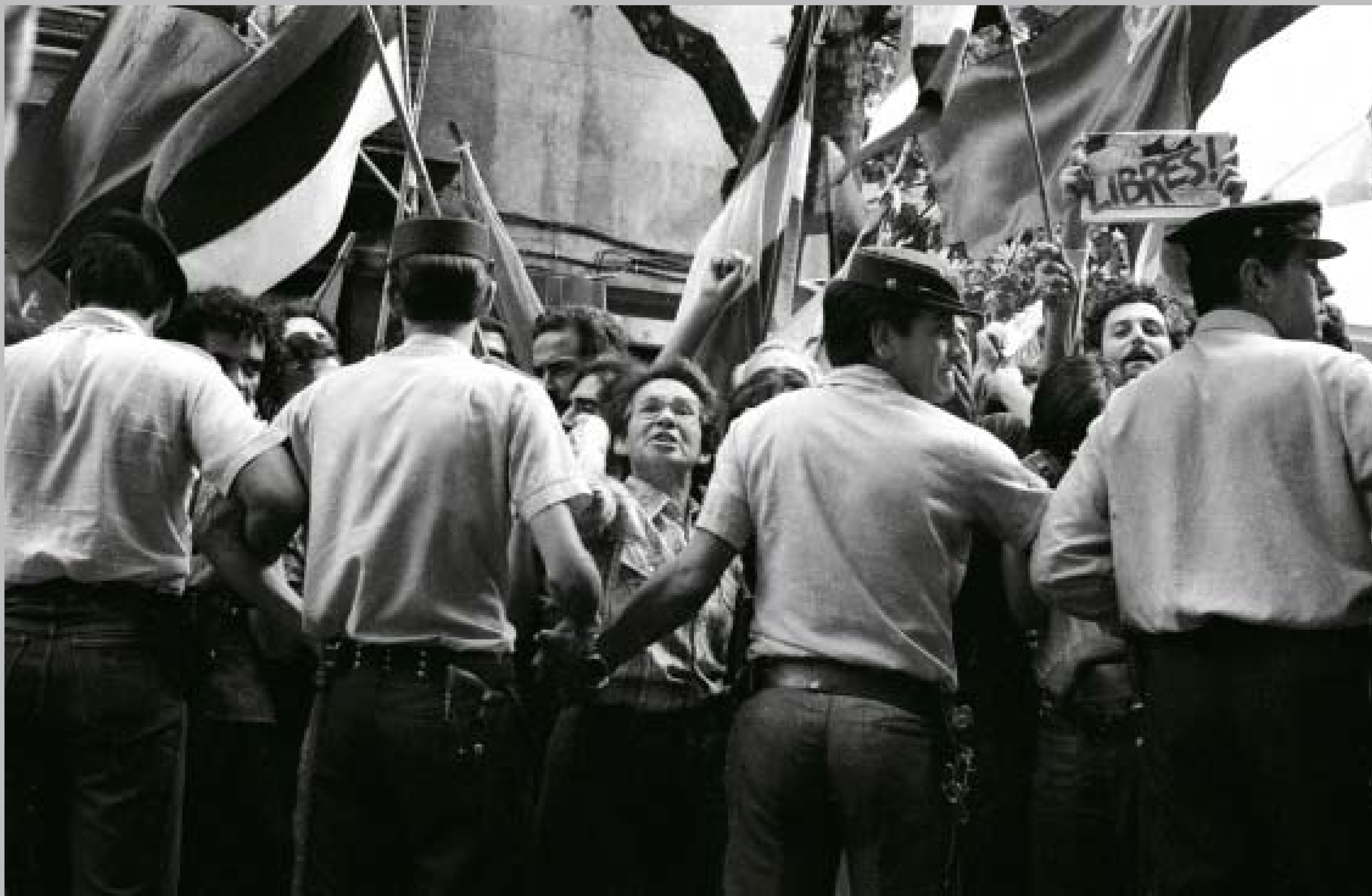
Jefatura de Policía de Montevideo en las calles Yi y San José, desde donde fueron liberados los últimos presos políticos. 10-14 de marzo de 1985.