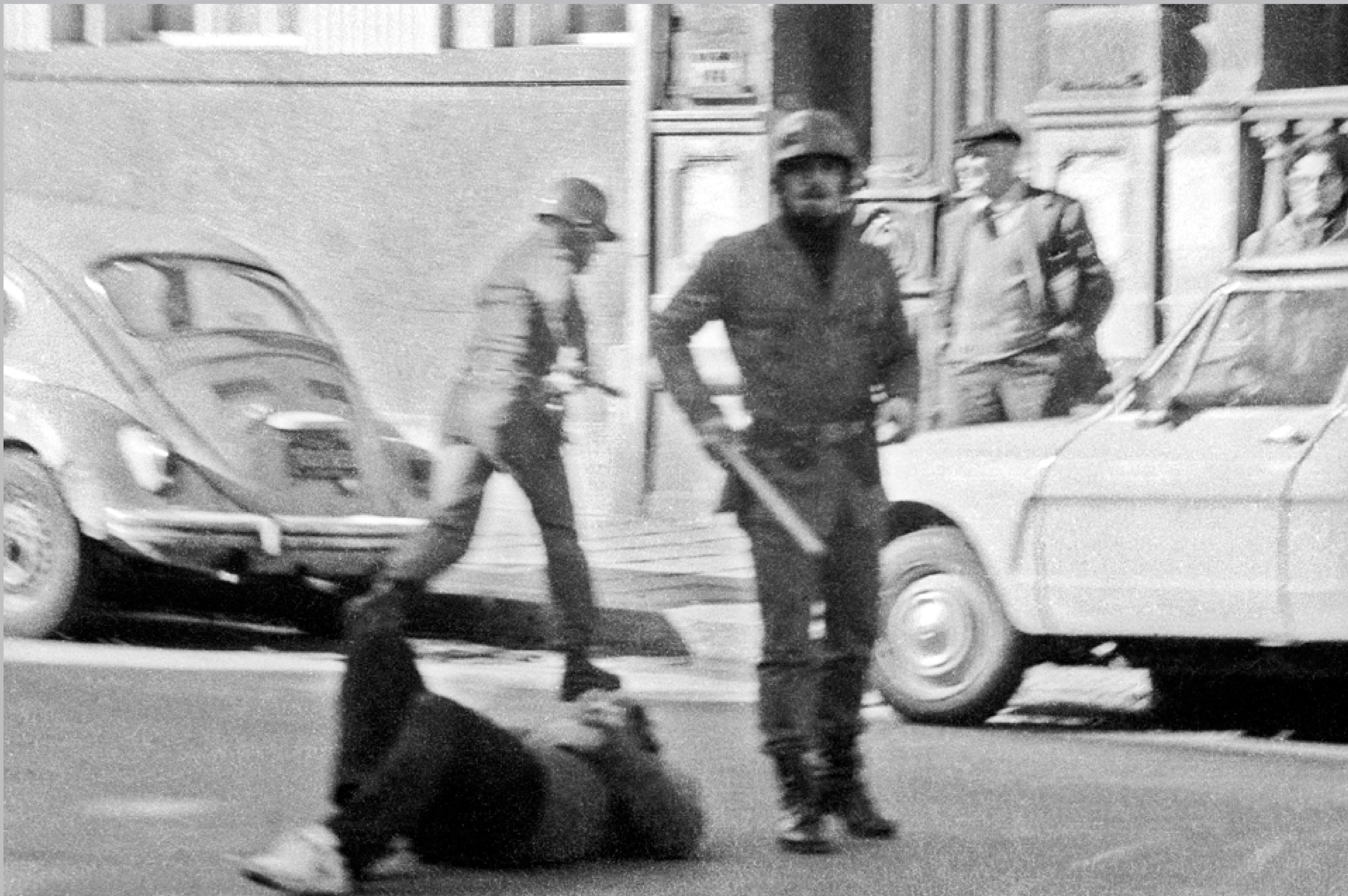
Represión de una manifestación antidictatorial. Avenida 18 de Julio y Tristán Narvaja. 3 de junio de 1984.