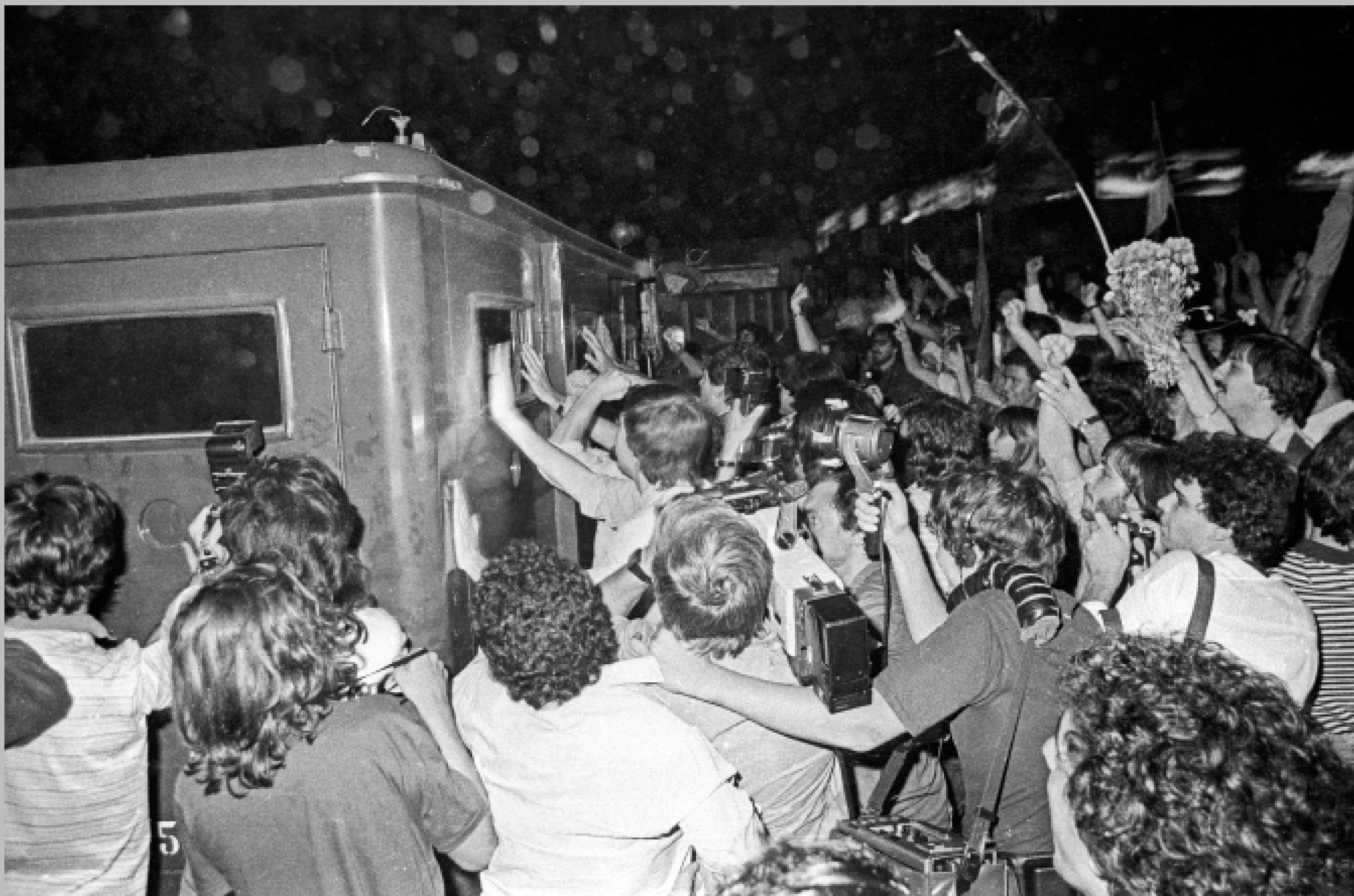
Liberación de presos políticos. Marzo de 1985.