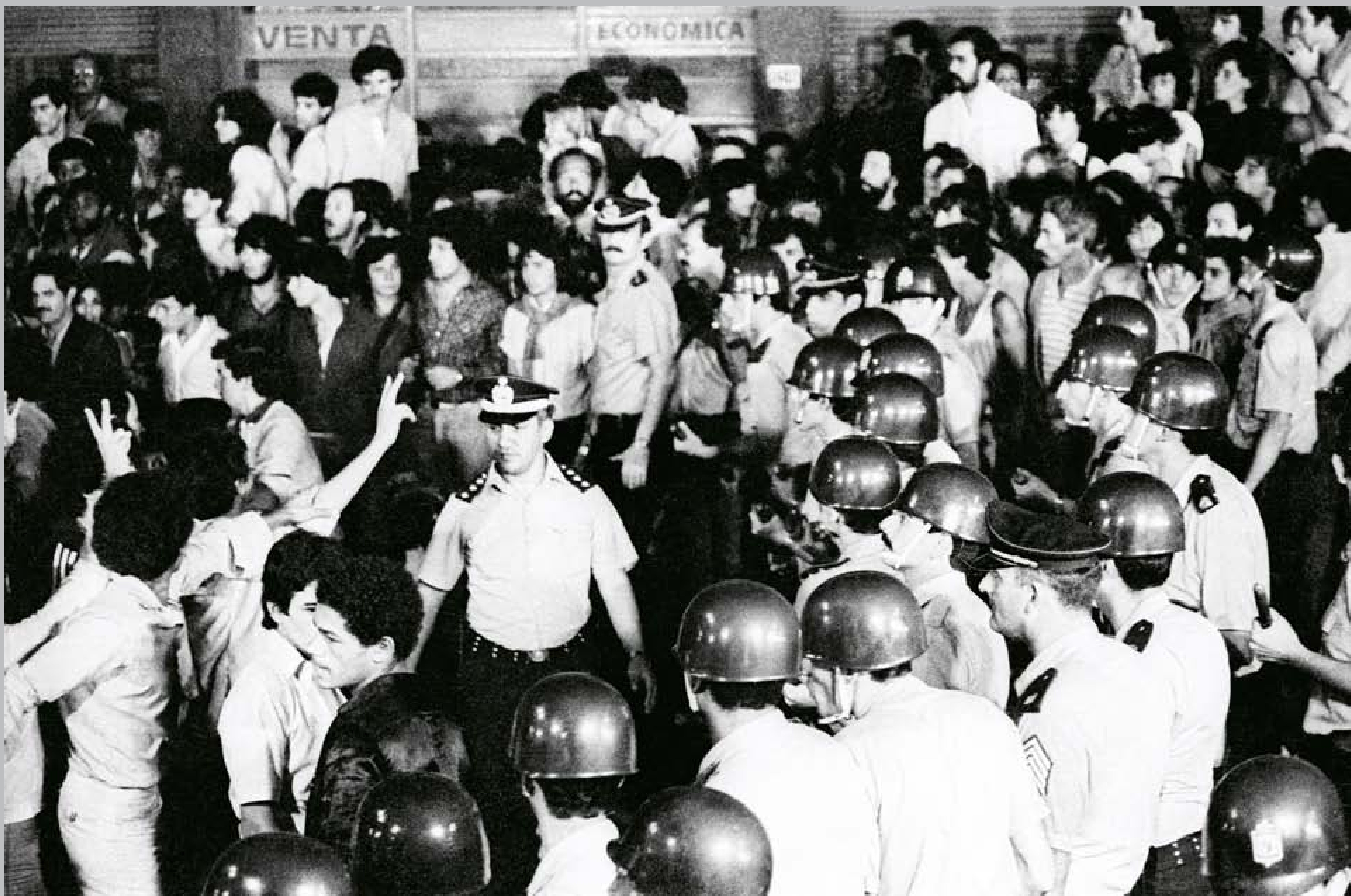
Desfile inaugural de las Llamadas. 9 de marzo de 1984.