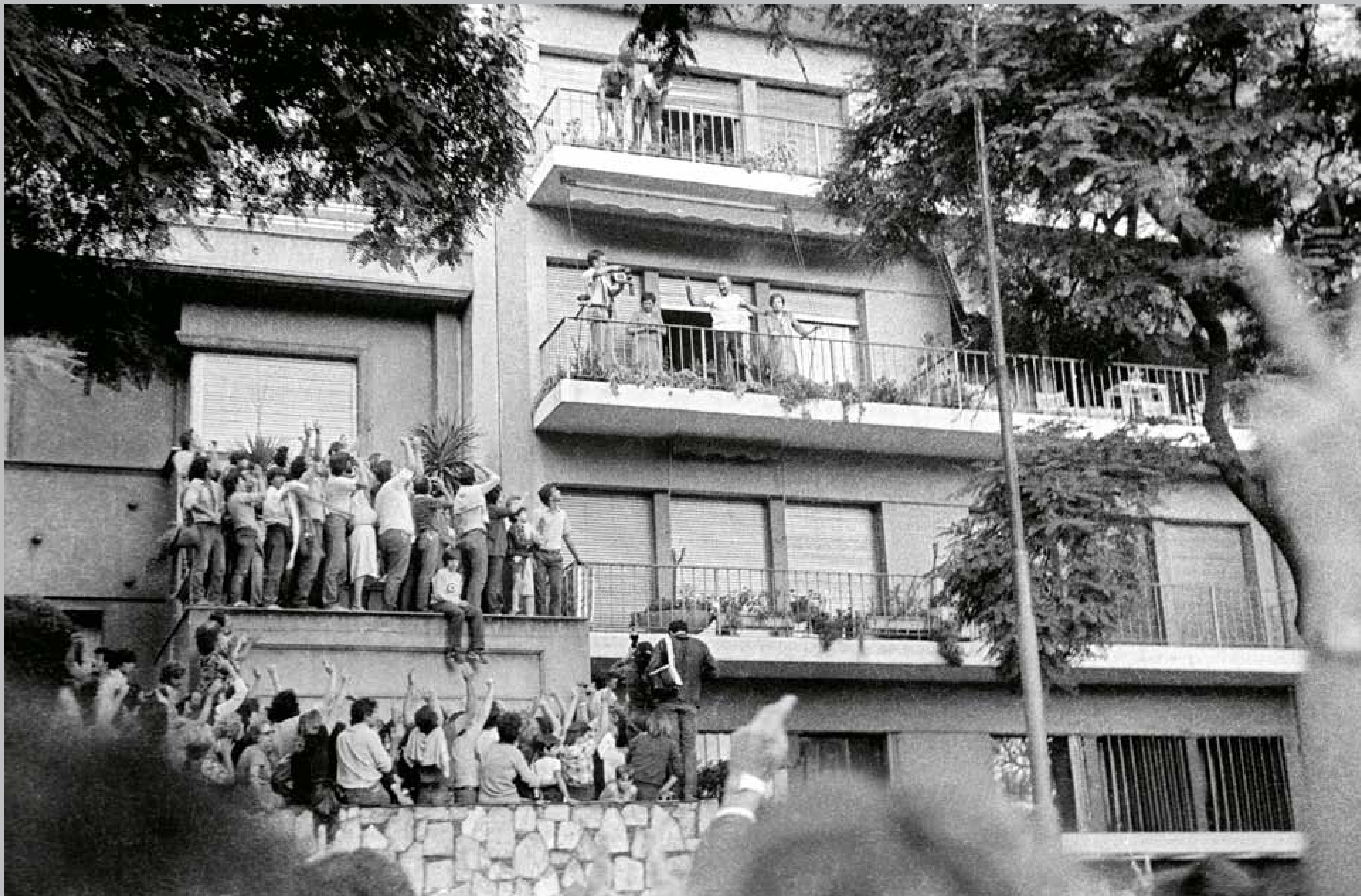
Liber Seregni y su esposa, Lilí Lerena, saludando en el balcón de su apartamento, ubicado en Bulevar Artigas y Bulevar España. 19 de marzo de 1984.