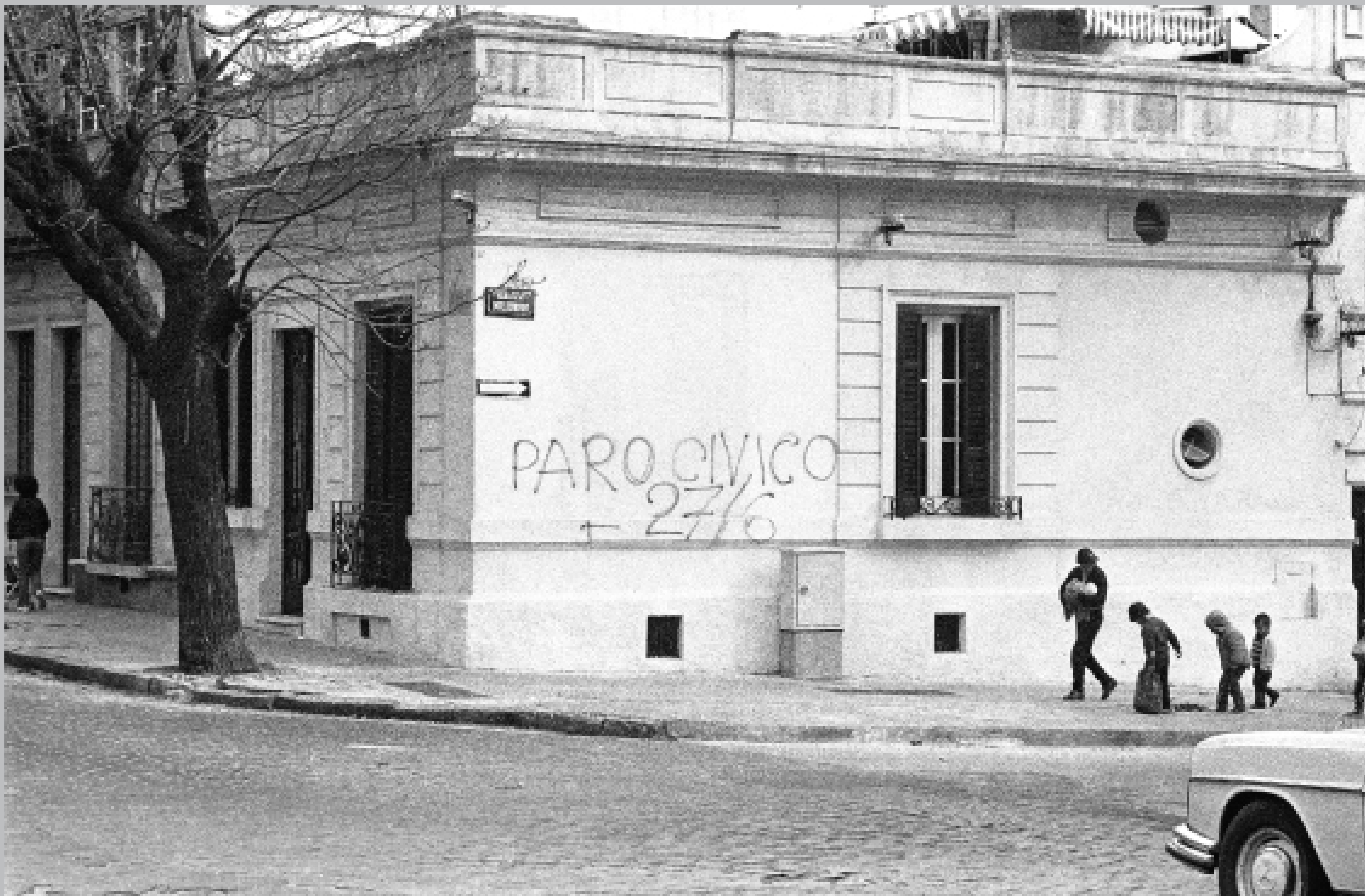
Intersección de las calles Obligado y Maldonado. 27 de junio de 1984.