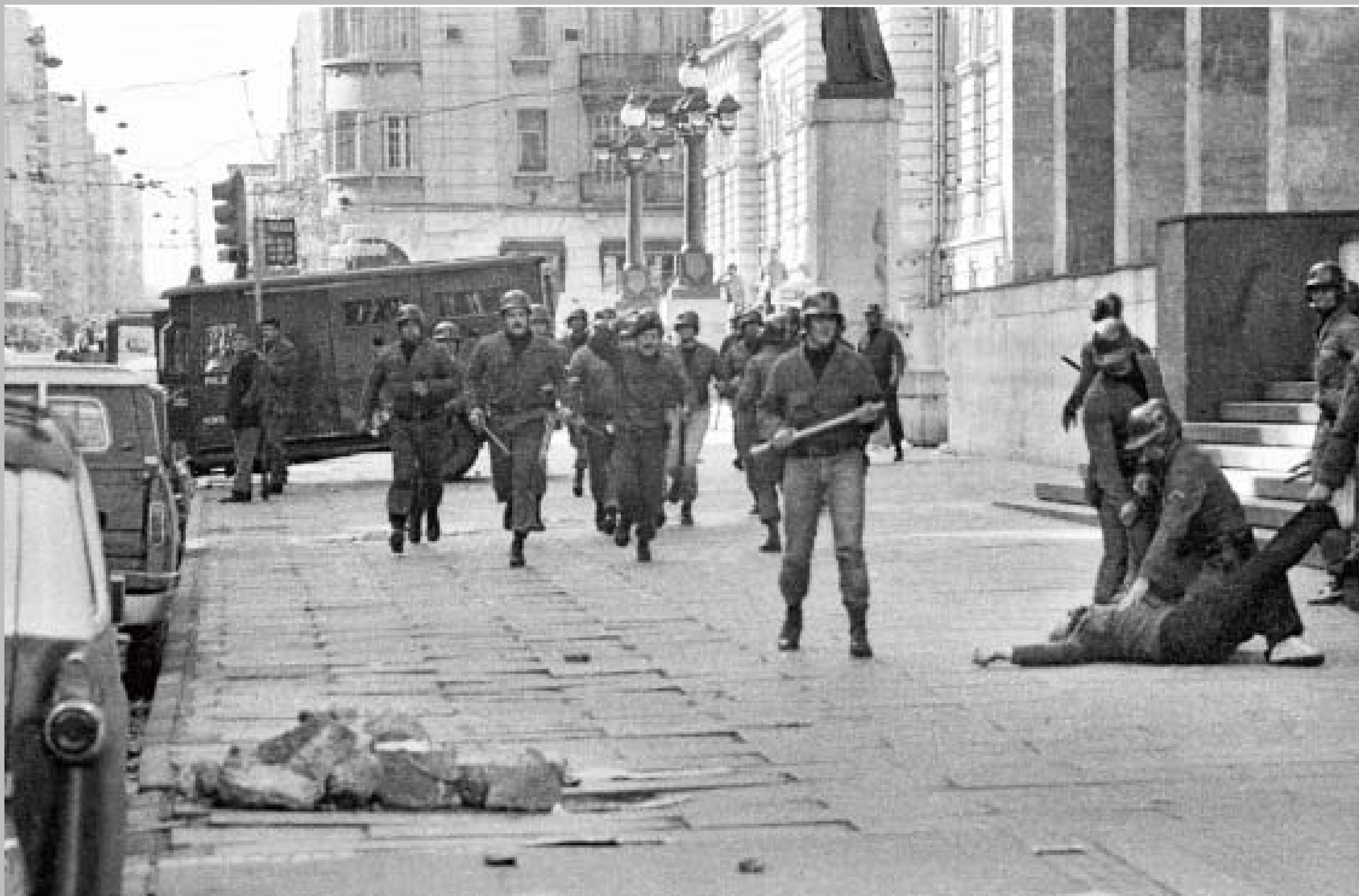
Represión de una manifestación antidictatorial. Avenida 18 de Julio y Tristán Narvaja. 3 de junio de 1984.