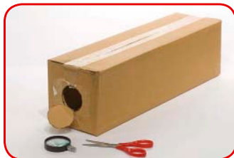
Cortamos el círculo marcado.