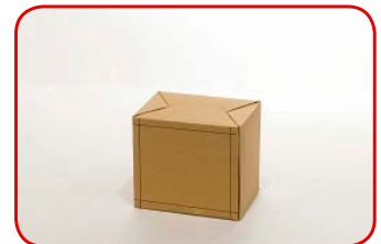
Cortamos una de las caras de la caja chica.