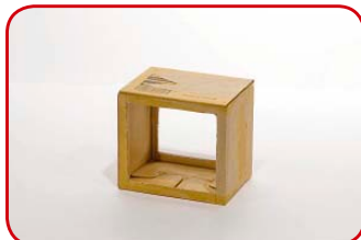
Realizamos lo mismo del lado opuesto.