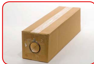
Colocamos la lupa a presión.