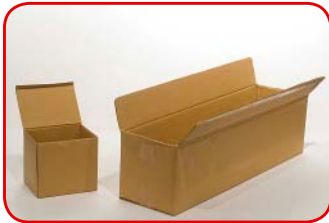
Dos cajas de cartón. Una más grande que otra.