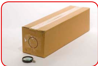
Marcamos con lápiz el diámetro exacto de la lupa.