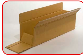
Cortamos una de las caras chicas de la caja grande.