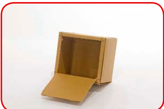
La abertura tiene que quedar 1 cm más chica de cada lado.