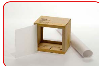
En una de las aberturas colocamos con cinta una tapa de papel calco.