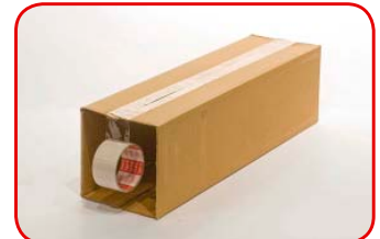
Pegamos con cinta la parte superior de la caja.