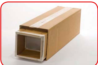
Colocamos la caja chica dentro de la grande, con el calco hacia el lado de la lupa.