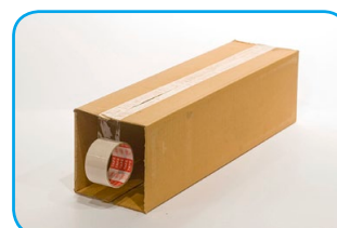
Pegamos con cinta la parte superior de la caja.