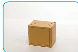
Cortamos una de las caras de la caja chica.