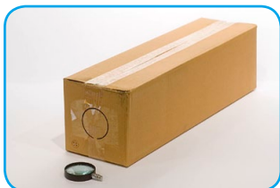
Marcamos con lápiz el diámetro exacto de la lupa.