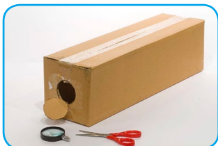
Cortamos el círculo marcado.