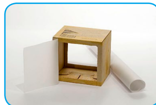
En una de las aberturas colocamos con cinta una tapa de papel calco.