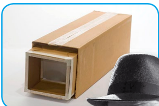
Colocamos la caja chica dentro de la grande, con el calco hacia el lado de la lupa.