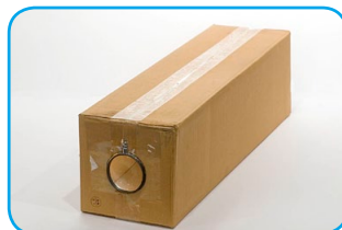
Colocamos la lupa a presión.