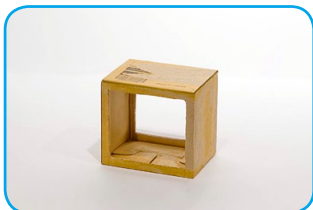
Realizamos lo mismo del lado opuesto.