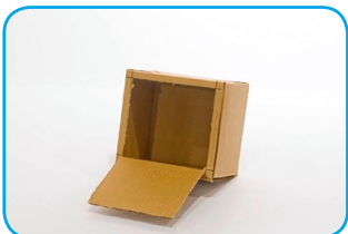
La abertura tiene que quedar 1 cm más chica de cada lado.