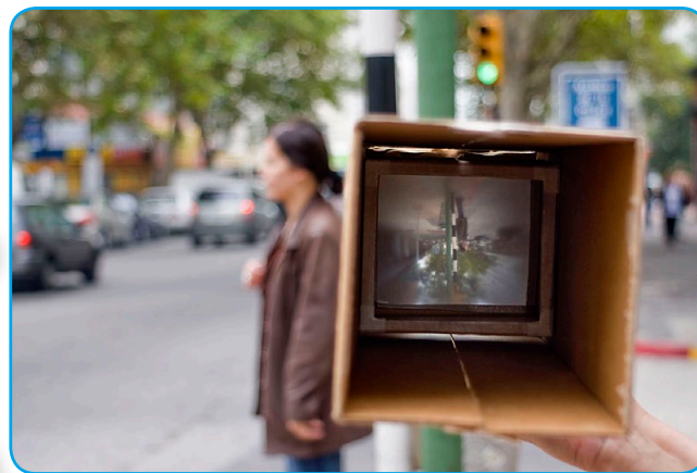
¡A mirar por la cámara oscura!