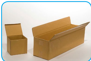
Dos cajas de cartón. Una más grande que otra.